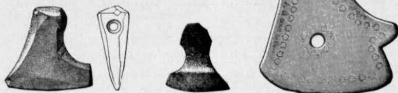
Fig. 3. Bärnsten. \frac{1}{1} . Fig. 4. Bärnsten. \frac{1}{1} . Fig. 6. Brons. \frac{1}{1} .

I intressant motsättning till alla dessa yxsymboler, hvilka afbilda samtida järnyxor, står ett litet föremål från Gotland, som, ehuru anträffadt i ett fynd från yngre järnåldern, efter allt att döma skall föreställa en stenyxa ( fig. 7 ). Pjäsen, det minsta af alla här berörda föremål, är af kritartadt ämne, förmodligen sådan korall: enkrinitstam, som ofta användts till pärlor under ifrågavarande period på Gotland. Den hittades jämte 4 pärlor af glasfluss ligande inom den uppåtvända urhålk-