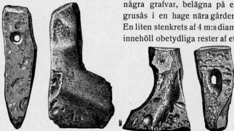
Fig. 1. Bärnsten. \frac{1}{1} .

några grafvar, belägna på en grusås i en hage nära gården. En liten stenkrets af 4 m:s diam. innehöll obetydliga rester af ett