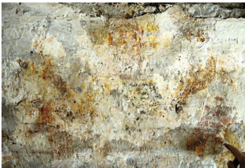
Fig. 2. Majestas Domini under framtagning. —Christ in Majesty on the chancel's east wall.

tryck i målningssviten i Marka. Målningarna här är i stället mer stiliserade och statiska i uttrycket och inte så detaljerade, fastän man kan se välarbetade mönsterpartier i till exempel dräkterna och tekniskt drivna glans- och högdagrar på händer och fötter. Här måste man ju också minnas att de varit överkalkade. Mycket av det översta målningsskiktet, det som utgjort målningarnas plastiska yttre – med högdagrar, lasyer och viktiga detaljer som pupiller etc. – har för alltid gått förlorat i och med överputsningen.