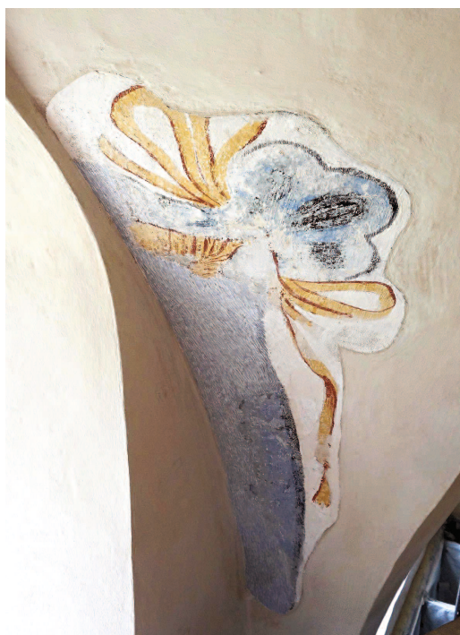
Fig. 1. Fragment av 1700-talsmåleri i långhuset. — Fragmentary 18th century mural in the nave.

De medeltida målningarna har en tydlig romansk prägel både vad gäller stiluttryck, färg- och motivval. De är utförda i al secco -teknik, det vill