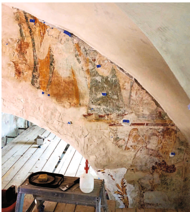
Fig. 6. Triumfbågsmyrens målningar under framtagning. —Murals on the wall next to the triumphal arch.