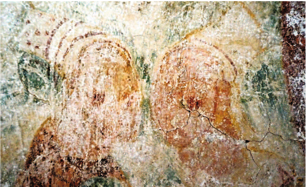
Fig. 4. Detalj av Marias och Elisabets möte på den norra korväggen. —Detail of The Visitation, the meeting of Mary and Elizabeth on the chancel's north wall.