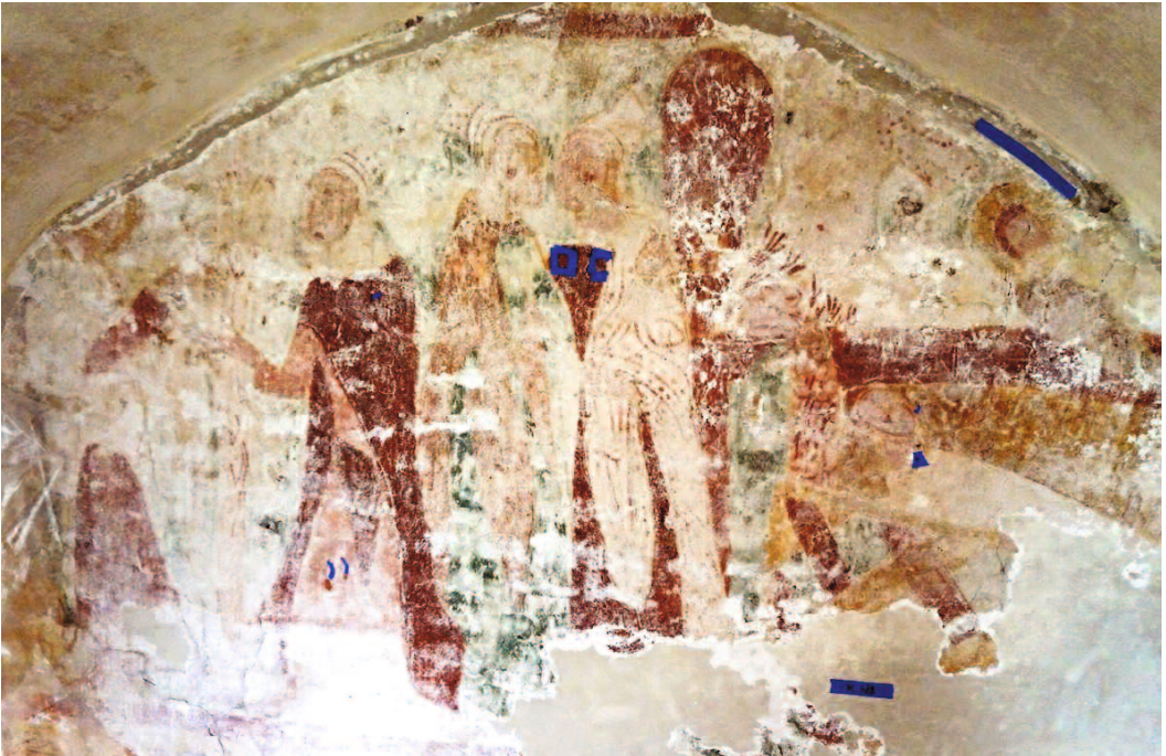
Fig. 3. Korets norra vägg. —The chancel's north wall.