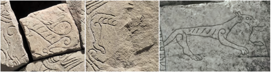
Fig. 3. Fyrfotadjuret på Björköstenen U 6 och ristningen Sö 313 i Södertälje uppvisar flera stilistiska likheter. —The quadrupeds from the Björkö stone U 6 and the carving Sö 313 in Södertälje show several stylistic similarities.