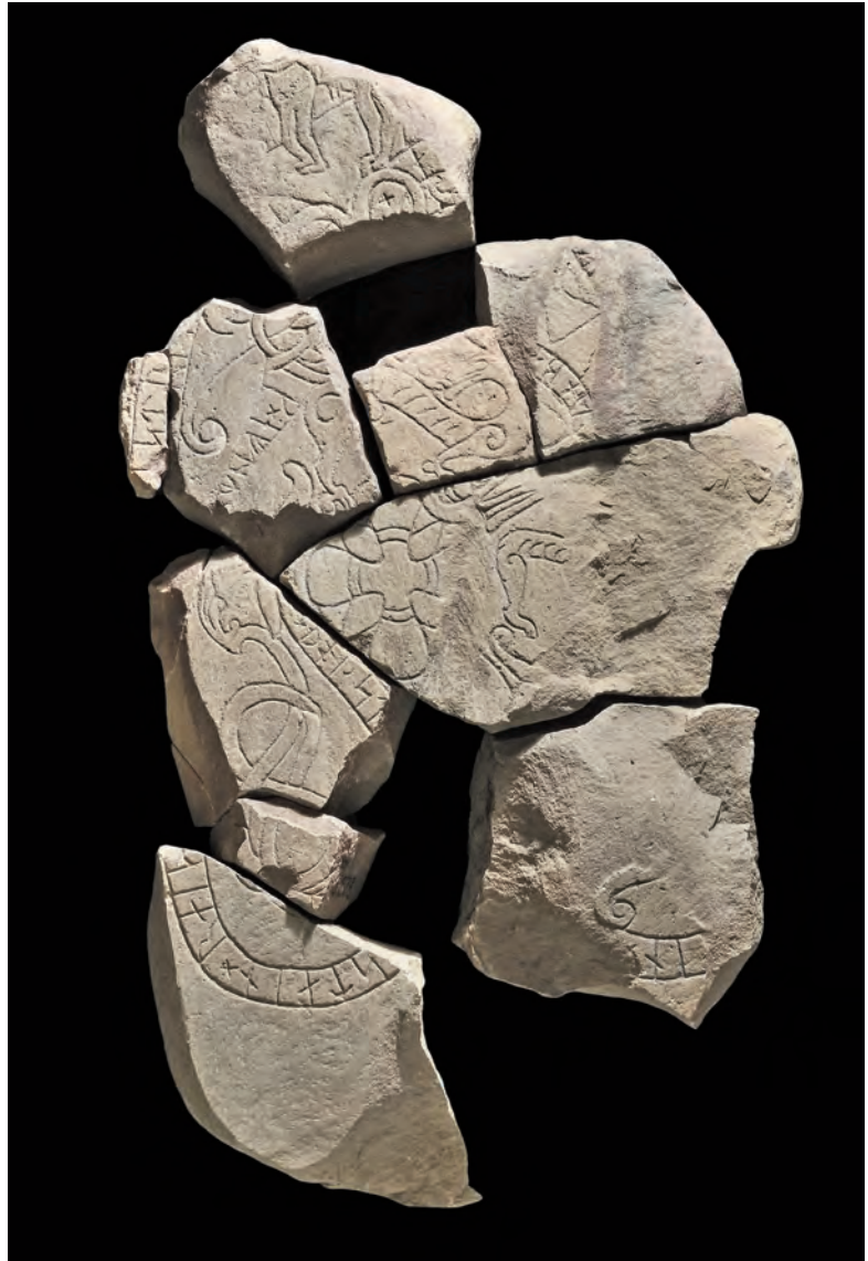
Fig. 1. Runstenen från Björkö by: pusslet är lagt och alla bitar har fallit på plats! —The Björkö hamlet runestone: the puzzle is completed with all the pieces in their places!