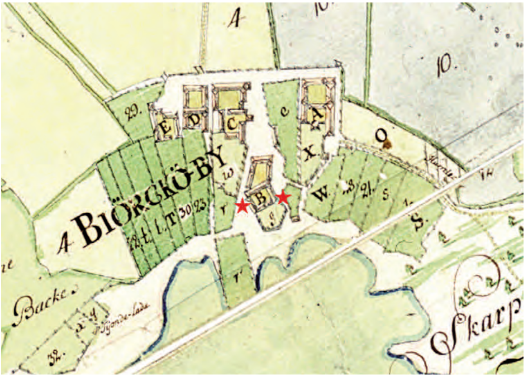
Fig. 5. Björkö by avbildad på storskifteskartan från 1747. De två senast påträffade runstensfragmenten (1992 resp. 2012, markerade med stjärnor) har framkommit på ömse sidor om byggnader tillhörande den forna frälsegården Storgården (B). —Björkö hamlet as depicted on a land survey map from 1747. The two most recent finds of runestone fragments (1992 and 2012, marked with stars) were made close to buildings belonging to Storgården, a former tenant farm.

fall stod? Flertalet fragment bidrar inte med någon större hjälp i detta sökande, eftersom fyndplatserna inte är närmare angivna. Men för två fragment är förhållandena bättre och fyndplatserna kända – om än inte helt säkerställda. Såväl det nyfunna fragmentet som det större av de två som tillvaratogs 1992 har framkommit på gräsplanen nedanför Oppgården.