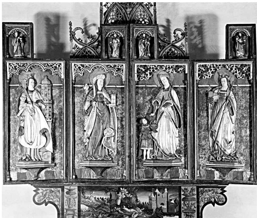
Fig. 2. Altarskåp från 1526 med stängda flyglar visande reliefer av kvinnliga helgon. —Altarpiece from 1526 with closed wings showing women saints.

talets mitt är anmärkningsvärt. Även samtliga helgonskåp tycks ha stått kvar i kyrkorummet fram till riksantikvariens besök 1867. Det vore intressant att undersöka om det var unikt för Västra Ed eller om bruket levde kvar även i andra småländska kyrkor. Som sagt ersattes många medeltida kyrkobyggnader i Småland vid denna tid av stora nyklassicistiska kyrkobyggnader, de så kallade Tegnér-ladorna. Ett syfte med dessa, förutom det rent storleksmässiga, kan ha varit att man genom deras arkitektoniska utformning helt enkelt kunde bygga bort äldre, oönskade sedvänjor som man ännu inte riktigt lyckats få bukt med i socknarna (Herman Bengtsson, muntlig uppgift).