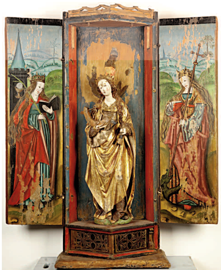
Fig. 6. Helgonskåp från det tidiga 1500-talet med Sankta Katarina av Alexandria. Foto: Lennart Karlsson. —Early 16th century shrine with St. Catherine of Alexandria.

dramatiskt fladdrande ländklädet som Kristus bär i korsfästelsescenen, och vars ändrar står ut från vardera sidan av kroppen. Dessa bryter av effektfullt mot resten av plagget som är symmetriskt arrangerat över den nyligen dödes höfter. Dramatiska tillägg är även den ängel och den djävul som på var sida om korsfästelsescenen svävar bort med de två rövarnas själar.