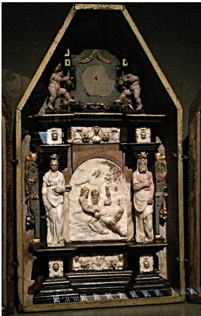
Fig. 8. Alabasterskåp från 1550-talet med Lot och hans döttrar. Foto: förf. —1550s alabaster shrine with Lot and his daughters.

så påfallande likheter med några av de mindre figurerna i det stora altarskåpet, framför allt skildringen av Kristus i dödsriket, varför det verkar rimligt att de är samtida. Förmodligen har även den mindre skulpturen förvärvats vid ungefär samma tid och kanske från samma verkstad, då både altarskåpsfigurerna och den mindre skulpturen är snidade i lind.