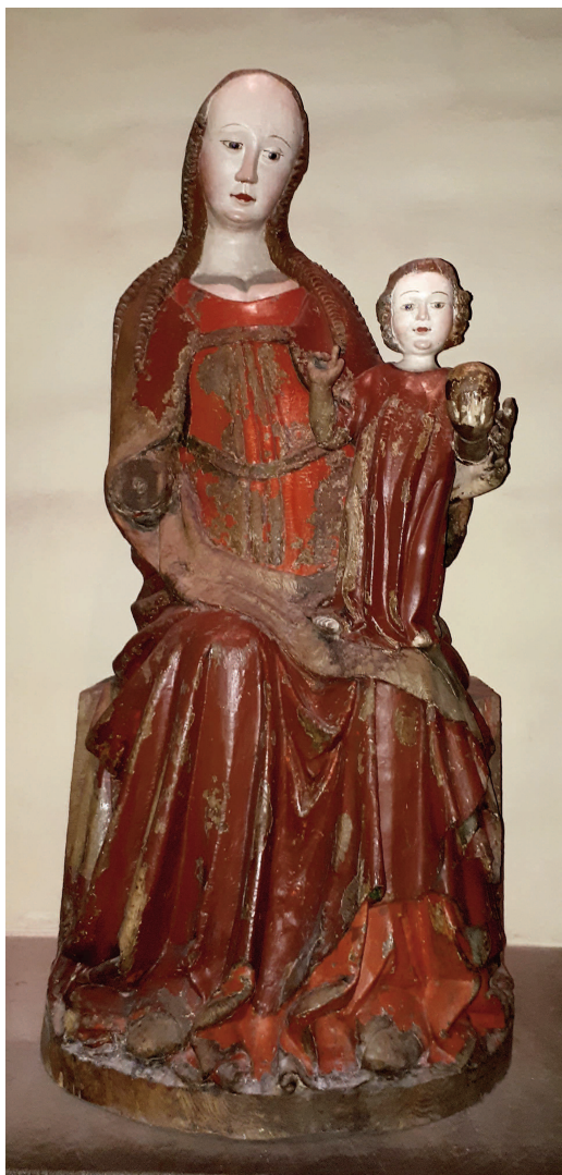
Fig. 1. Omarbetad 1300-talsmadonna. —Reworked 14th century Madonna.

Wilund arkitekter & antikvarier där man bland annat fogade om murarna med hydrauliskt kalkbruk, fäste lösa stenar, tätade gamla cementtäckningar samt utförde nya avtäckningar på sakristian och den bevarade korpelaren. I samband med detta skrevs också en vård- och underhållsplan (Wilund 2014).