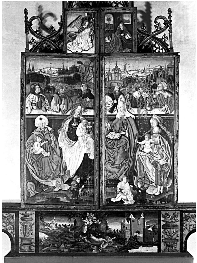
Fig. 5. Altarskåpets flygelmålningar av Heliga släkten. —Depictions of the Holy Kinship on the altarpiece's wings.

Intressant är att man inte valt samma ornament på båda sidor av motivet utan givit vardera sidan olika varianter utförda i grisaille. Även formen på själva predellan avviker, med sina brutna passformer i ändarna, från den gängse formen med lätt svängda sidoförmer. Bruket av akantus som huvuddrag i både ornament och masverk är påtagligt. De plastiska akantusornamenten, som bland annat slingrar sig runt stavar, är i flera fall tillverkade av klippt och format tenn för ett mjukare, mer naturtroget utseende och en ökad realism. Även andra typer av ornament tillverkade i metall förekommer, som löv i tenn och som beslag i olika stjärn- och blomformer på hästarnas seldon. Delar av Jesu törnekrona är likaså tillverkade i metall för att accentuera den visuella effekten. Ornament och skulpturdelar i andra material förekommer i sengotisk träskulptur, bland