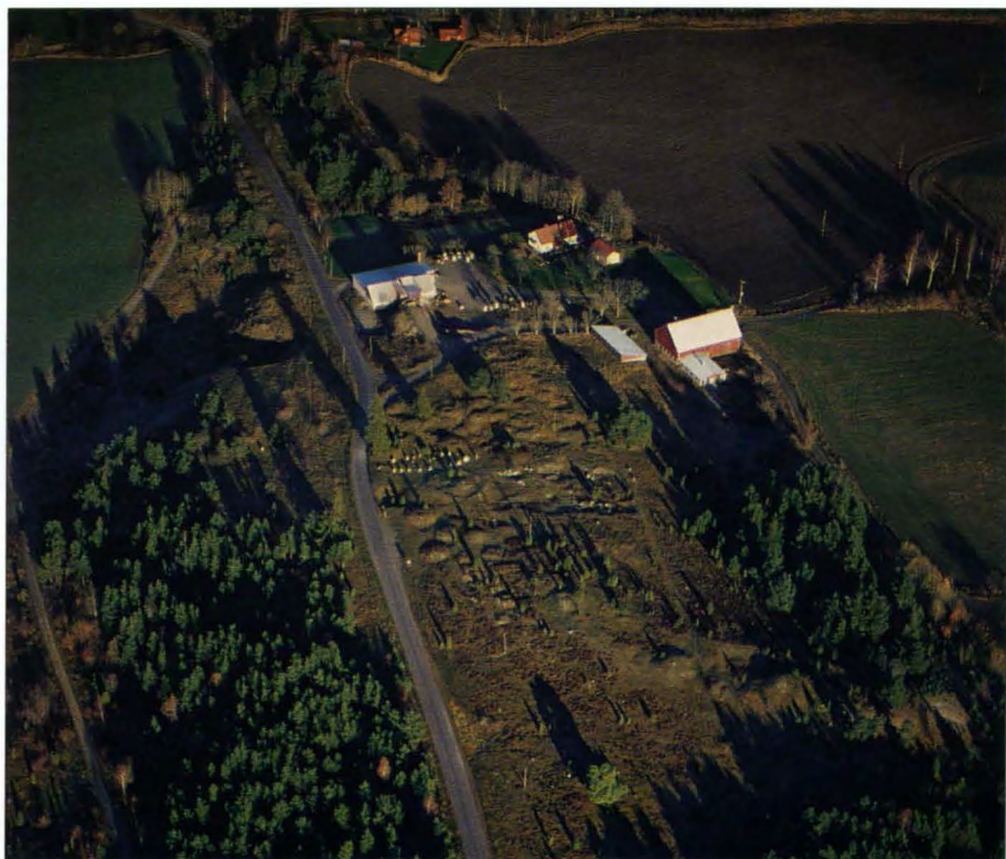
Områden av riksintresse för kulturmiljövården bör vid behov undantas från tillstånd vid prövningen. Bedömningen görs med tanke på fornlämningen som en del i kulturmiljön. Gravfält vid Åsa, Selaön, Ytterselö sn i Södermanland.

forskningsprogram eller liknande. I sådana fall bör tillstånd givetvis kunna ges och skall då ställas till den institution som övergripande svarar för projektet.