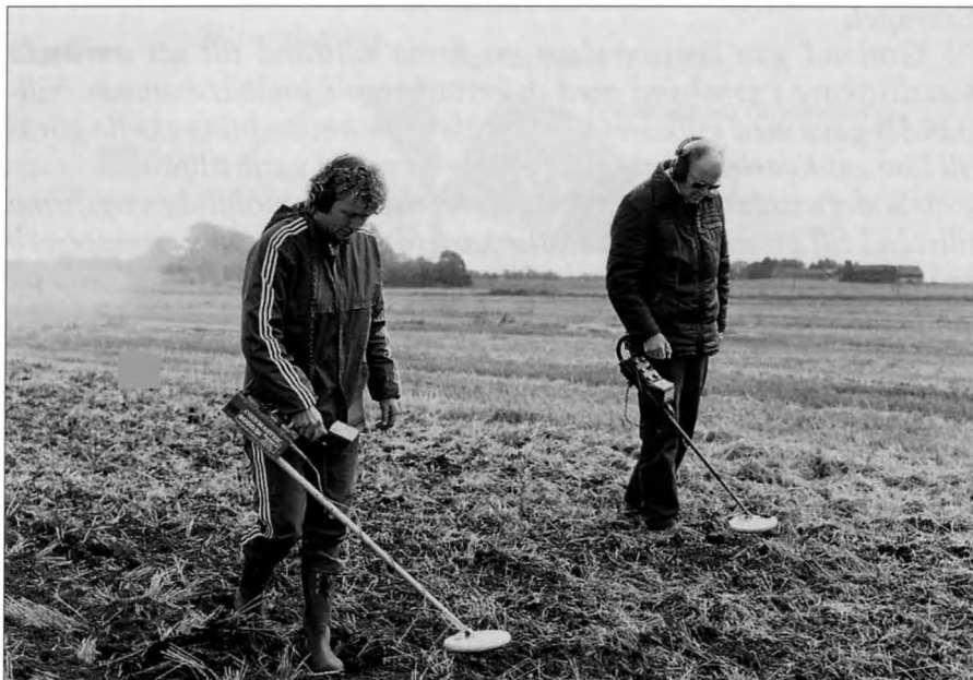
Efterundersökning med hjälp av metallsökare. Skaraborgs Länsmuseum efterundersöker fyndplatsen för bronssköldarna från Fröslunda, Sunnersbergs sn i Västergötland.

ning, t.ex. mynt eller kulturhistoriska föremål. Hembygdsforskning och intresse för arkeologi är positiva förtecken i detta sammanhang. Det kan dock inte uteslutas att sakletning i inte ringa omfattning bedrivs utifrån samlarbegär och vinstintresse.