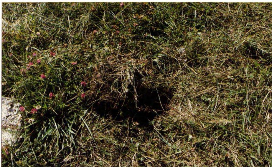
En av drygt 80 plundringsgropar vid Hovgården, Adelsö socken i Uppland, sommaren 1992. Efter plundringen hade grästorven lagts tillbaka för att dölja hålen.

ning och träning av minröjare utnyttjas också metallsökare i ökad utsträckning. Även andra uppgifter, som sökning efter mätpunkter, kan förekomma inom militär verksamhet.