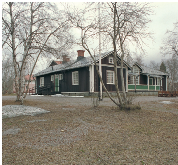
Hjalmar Lundbohmsgården, minnesgård och museum i Kiruna. 1998.

Riksantikvarieämbetet har varit i kontakt med olika föreningar i Malmfälten bland annat i samband med tre medborgarmöten kring kulturmiljöanalysen för Gällivare/Malmberget/Koskullskulle. Föreningen Kirunas Rötter deltog med flera personer och hjälpte till vid Riksantikvarieämbetets konferens i Kiruna 2008 genom att ta emot deltagarna i Hjalmar Lundbohmsgården.