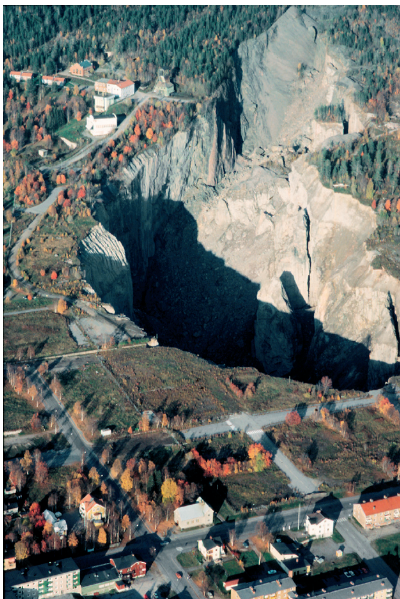
Flygbild av Kaptensgropen i Malmberget. 1970-tal.