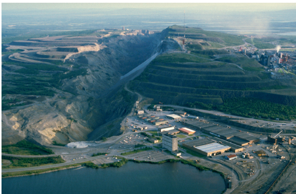
Flygbild över Kiruna. 1994.

I Malmfälten finns en kulturhistoria som sträcker sig flera tusen år tillbaka innan gruvsamhällena anlades. Gruvnäringen spelar dock sedan drygt hundra år en avgörande roll och är intimt sammanflätad med kulturen och livsmiljön. Brytningen av järnmalm har inneburit såväl förluster som vinster för lokalsamhällena. Landskapet har utsatts för avsevärda påfrestningar i och med grubbrytningen. För den svenska nationen har mineraltillgångarna medfört stora ekonomiska vinster under många decennier. 2008 var ett rekordår för gruvföretaget LKAB. Företaget förutspår fortsatt efterfrågan på lång sikt på den globala marknaden och har därför fattat beslut om ytterligare investeringar och brytningsnivåer. I april 2009 har den ekonomiska lågkonjunkturen även nått LKAB och företaget redovisar en kraftigt minskad nettoomsättning för det första kvartalet ( www.lkab.se ).