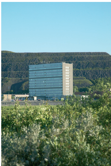
LKAB:s kontor i Kiruna. 2006.

Flera av landets framstående arkitekter och konstnärer påverkade planering, byggande och kulturliv i Malmfälten kring 1900. De inspirerades av internationella influenser kring konst, arkitektur och stadsplanering och fick anledning att pröva sina idéer – framför allt i Kiruna tack vare disponenten Hjalmar Lundbohm. I Malmfälten återfinns karakteristisk trähusbebyggelse från 1900-talets början inom bolagsområdena och inom SJ-området. Det finns även modern bebyggelse som har koppling till den ekonomiska konjunkturuppgången i slutet av 1950-talet då LKAB övertogs av staten. Här finns storskalighet i bebyggelsen, till exempel det internationellt välkända