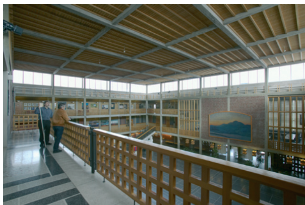
Stadshuset i Kiruna. 2006.