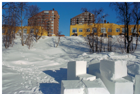
Kvarteret Ortdrivaren i Kiruna. Hus ritade av arkitekten Ralph Erskine. 2000.