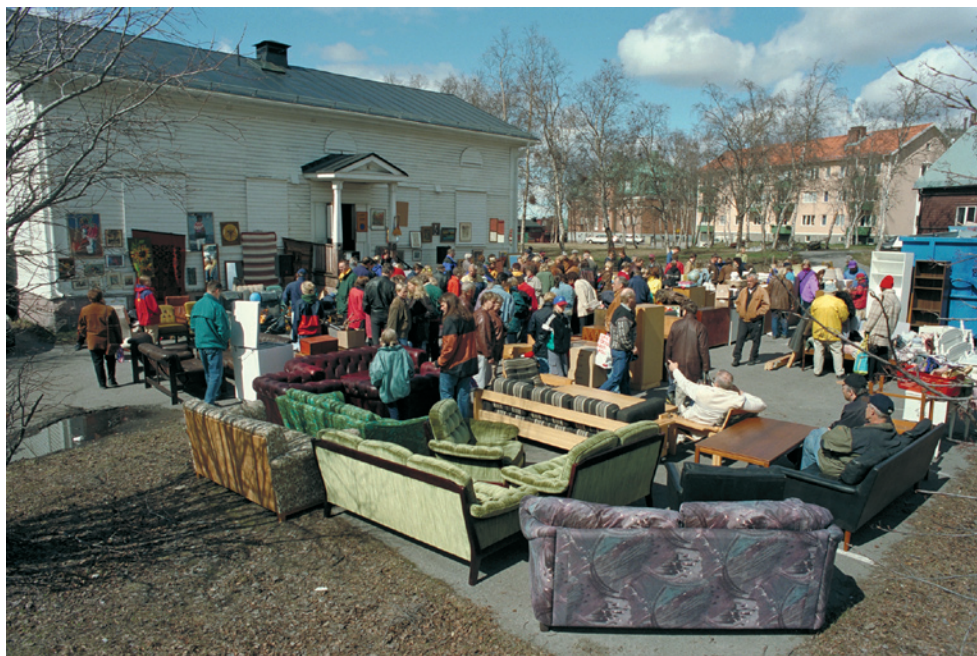
Auktion i Kiruna. 1998.

som någon större saknad. Vi var en del av gruvsamhället och något nytt höll på att formas.” (Holmstedt 2008:4.) Nu konstaterar barnen i Gunillaskolan att deras skola troligen kommer att rivras och att: ”Malmberget kanske försvinner.” (Feldmann i Svensson och Wetterberg 2008:36) För svenska förhållanden har kulturmiljöerna och livsmiljöerna i Malmfälten, speciellt i Malm-