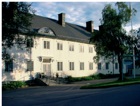
Bolagshotellet i Kiruna. 2007.