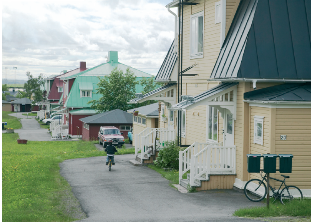
Arbetarbostäder i Kiruna , de s k "Bläckhornen", ritade av arkitekt Gustaf Wickman i början av 1900-talet. 2006.

Sedan dess har följande hänt kring dessa punkter: