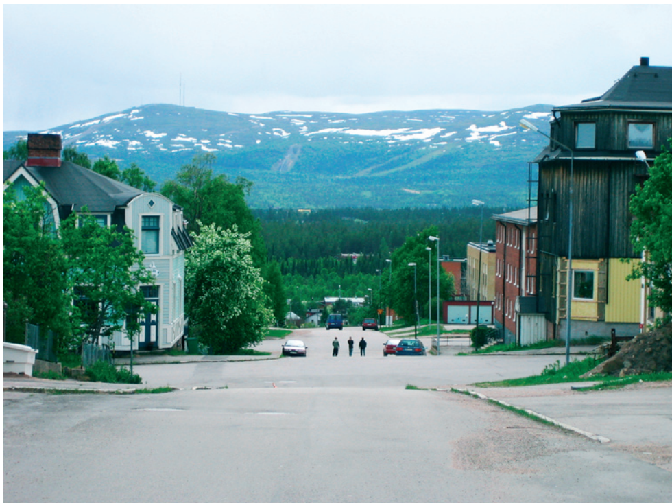
Centrala Malmberget, juni 2007. Foto mot söder, Birgitta Svensson.

I Malmfältens förändringsprocess är minerallagen tongivande. Tillståndet att vidga en gruva får dock inte strida mot plan- och bygglagen. Minerallagen gäller inte i stället för miljöbalken utan båda lagarna gäller bredvid varandra. Regelverket för förändringsprocesserna i Malmfälten är sammantaget mycket komplicerat. Tillämpningen kommer att vara tidskrävande i och med