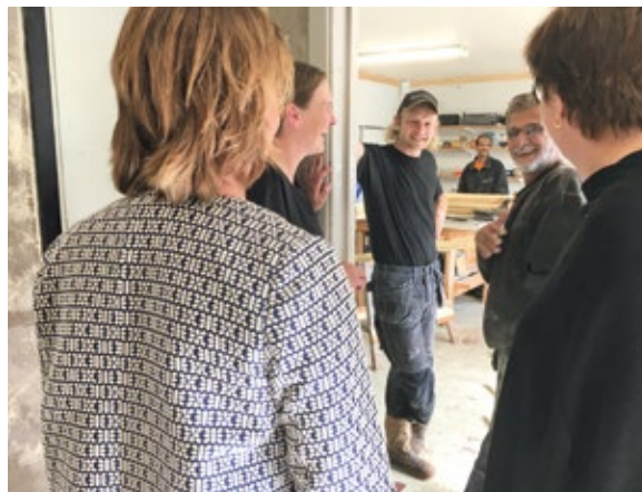
Besök i verkstaden av regionråd.

De olika besöken från kommun, region, länsstyrelse och insynsråd har gett en anledning att i projektet diskutera hur Sverige styrs och förvaltas. För några deltagare handlade det mest om att översätta termer och begrepp till strukturer de kände igen, men för några var det oerhört svårt att förstå vad till exempel riksdag och regering är. Vi tog då till uttrycket "boss of Sweden" – Sveriges chef, varpå ett "aha!" med bekräftande nick följde samt svaret "dictator!", ett uttryck för deras referensram. Landets förvaltning och styrning blev någonting vi passade på att diskutera med anledning av varje besök i projektet. Dessa klyftor i förståelse och erfarenhet är naturligtvis också något som avspeglas i arbetskulturen hos var och en. Vad förstår man av "eget ansvarstagande" och "initiativförmåga" om det enda man känner till är en diktatur och den enda formella arbetsplats man befunnit sig på tidigare är militären i samma diktatur? Vad blir konsekvensen av en sådan insikt för arbetsledningen? Att börja peka med hela handen?