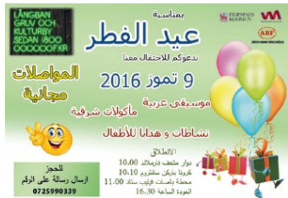
Inbjudan på arabiska till Eid al-fitr på Långban.

3. En dag hade kommunen identifierat en person med grafisk kompetens. Kunde vi ordna något? Jo, visst skulle vi kunna pröva en grafisk kompetens; vi kan både formge information och utveckla pedagogiska material – det ryms inom ramen för besöksmålsutveckling. Det var inte planerat, inte nödvändigt för projektet, men det var möjligt och meningsfullt.