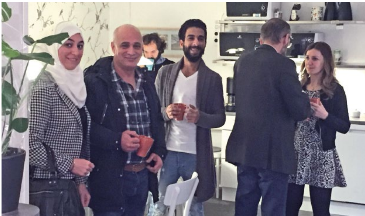
Starta-egget-kurs på arabiska. En insats av Arbetsmarknads- och integrationsenheten (AIE) Filipstad i samarbete med ALMI.

Värmlands Museum genomgår betydande förändringar i sin verksamhet. För att även i framtiden kunna vara en relevant mötesplats krävs strategiska förändringar och nya perspektiv, både för att matcha hur samhället ser ut och för att hitta former för till exempel bevarande, skötsel och användning av kulturmiljöer.