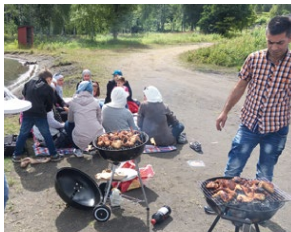
På lördagar kom det ofta grupper och familjer. För dem var också maten och umgänget viktigt.

Filipstads kommun och Värmlands Museum avser att stärka kulturmiljöns roll som attraktiv