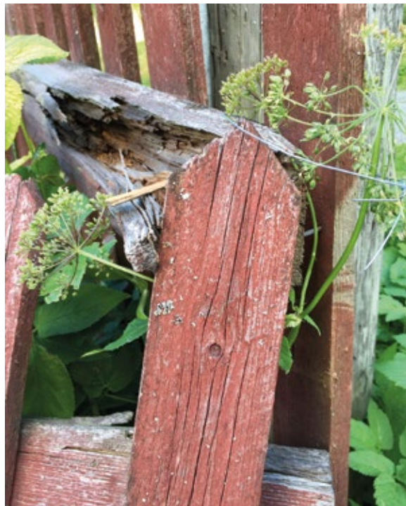
Vårdbehov: Staketet kring John Ericsongården.

Kommunens integrationsarbete har hittills främst varit inriktat på vägen till egen försörjning. Vägvisaren, ett kommunalt servicecenter bemanat med språkstöd som talar svenska och tigrinja,