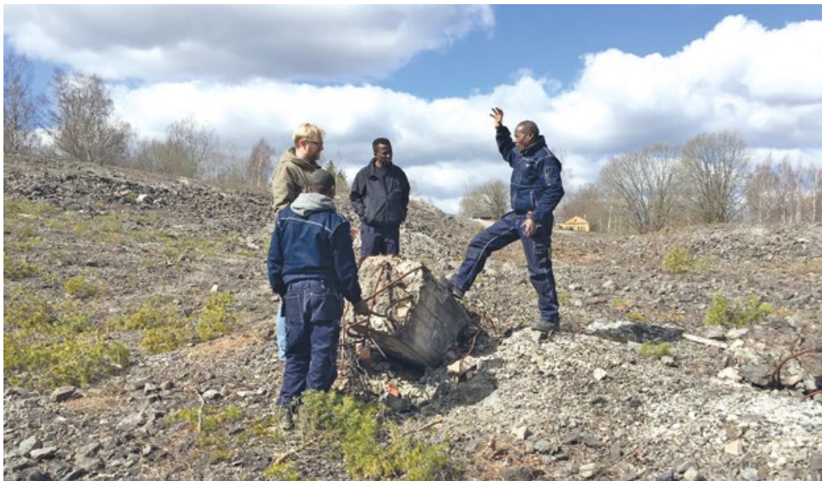
Antikvarie från Värmlands museum i samtal med deltagare om byggnadslämningar i gruvmiljön.