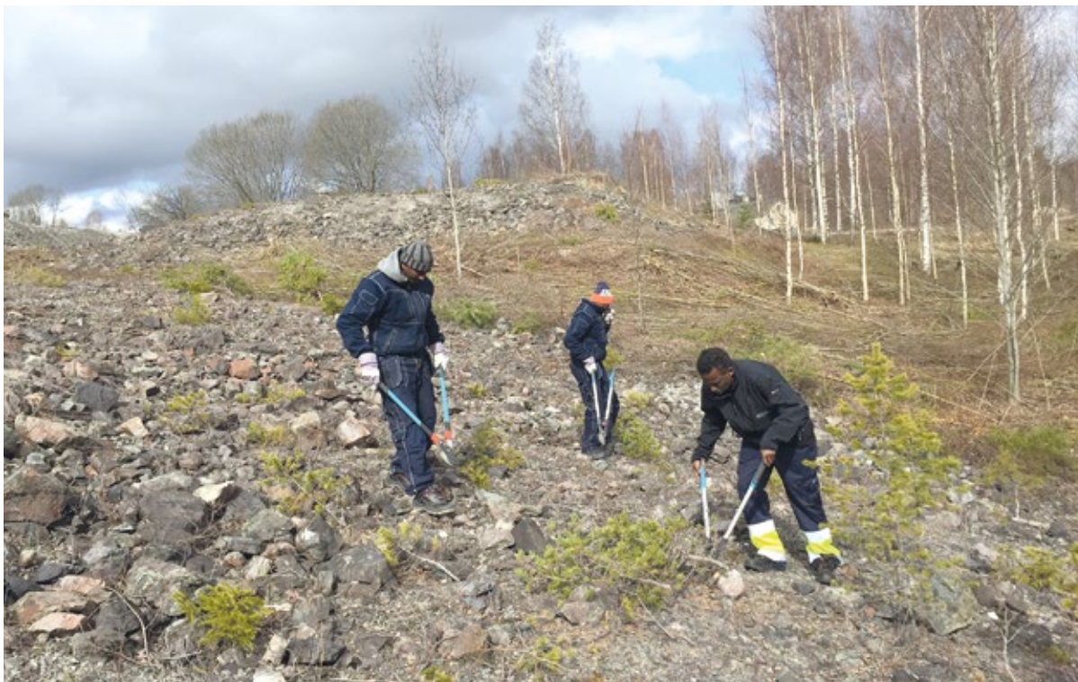
Slyröjningen frilade varphögar och tillgängliggjorde delar av kulturmiljön som vittnar om den tidigare gruvindustrin med järnväg, arbetarbostad, sågverk och byskola.