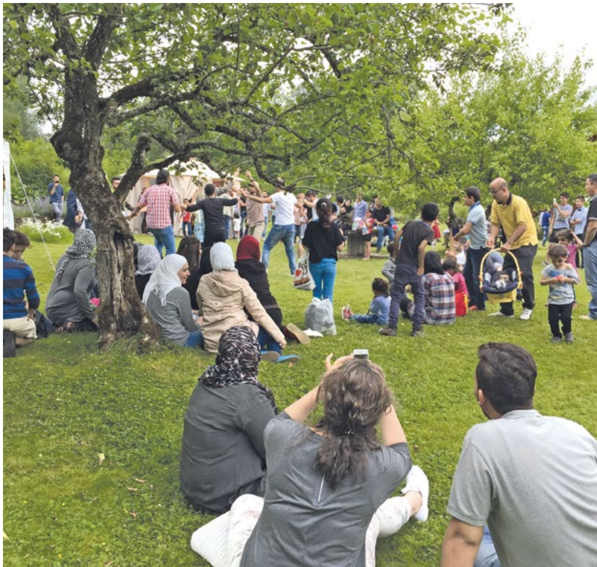
Eid al-fitr i Långbans- gruv och kulturby.