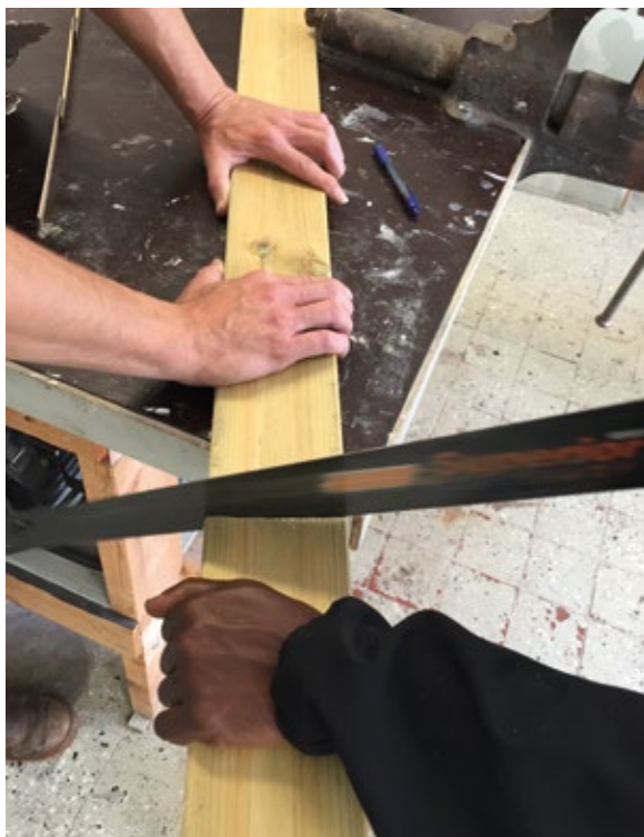
Handledare och deltagare utvecklar en sittgrupp till rastplats vid sjön.

Projektets intentioner är inte oproblematiskska för aktörer inom kulturmiljöarbetet. Det befinner sig i ett sammanhang med många frågeställningar, inte minst om vad det innebär att kulturmiljö och kulturarv kan vara en resurs. Behöver platsen och dess historia försakas i ett instrumentellt användande av någon annan? Eller är det möjligt att