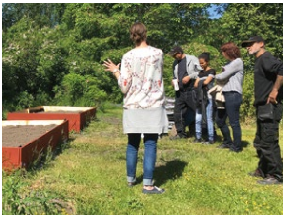
Rundvandringssamtal mellan deltagare i projektet och representanter från Riksantikvarieämbetet.

det; naturresurs (västra området/Tibergs udde) som en förutsättning för gruvindustrin (Långban gruv och kulturbby), vilken utvecklat bygden, bidragit till välfärdssamhället, och varit ett nav i många generationers liv (östra området). Leden omfamnar rent fysiskt den breddade berättelse som gjorts genom interpretationsarbetet och som utgör en av handlingsramarna för projektet.