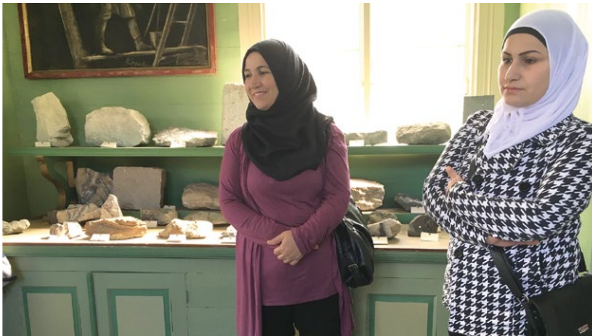
På besök i mineralmuseet.

Genom projektassistentens nätverk och kunskap om målgruppen, synergieffekter med andra integrationssatsningar i kommunen, samt det chansartade beslutet att satsa på en gratisbuss på lördagar hela sommaren, kunde civilsamhället göra en nygammal entré på Långban. Istället för ett par event för målgruppen om samhällsorientering, genomfördes samarbeten med målgruppen genom samhällsorientering och verksamhetsutveckling. Detta ledde till en explosion i utvecklingen av platsens publika program.