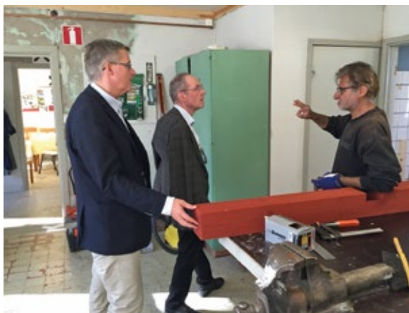
En deltagare berättar om det svenska virkets goda rykte i Syrien för riksantikvarie och överantikvarie under ett besök i verkstaden.

Visionen understryker uppgiften att använda kulturmiljön som en plattform för utbyte som medvetandegör våra handlingar ur ett samhällsperspektiv. Om ambitionen är att öka förutsättningarna för nyanlända att göra anspråk på kulturmiljön, så bör vi börja med att ställa frågor kring vad platsens historia är, hur den kommuniceras och vilket utrymme som ges till nya personer att anknyta, och skapa relationer till den.