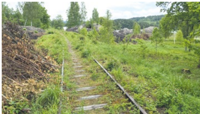
Slyröjningen öppnade upp kulturmiljön.

Projektet har visat att kulturmiljön och kulturarvet kan vara en resurs för integration genom: