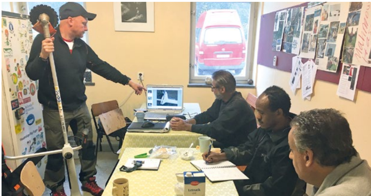
Genom yrkespraktiken kunde flera av deltagarna ta röjsågskort.

Den första uppgiften för projektdeltagare som yrkespraktiserade var slyröjning för att frilägga varphögarna. Det var en relativt enkel uppgift som gav utrymme för att etablera arbetsrutiner. Allt eftersom införde vi sedan mer avancerade moment, som till exempel hantering och skötsel av motorverktyg, självständighet i de egna arbetsuppgifterna och arbetsledningsansvar. För vissa innebar detta en kompetenshöjning, och för flera i gruppen har validering i form av röjsågskort skett. Tre av deltagarna har dessutom fått anställning efter projektet.