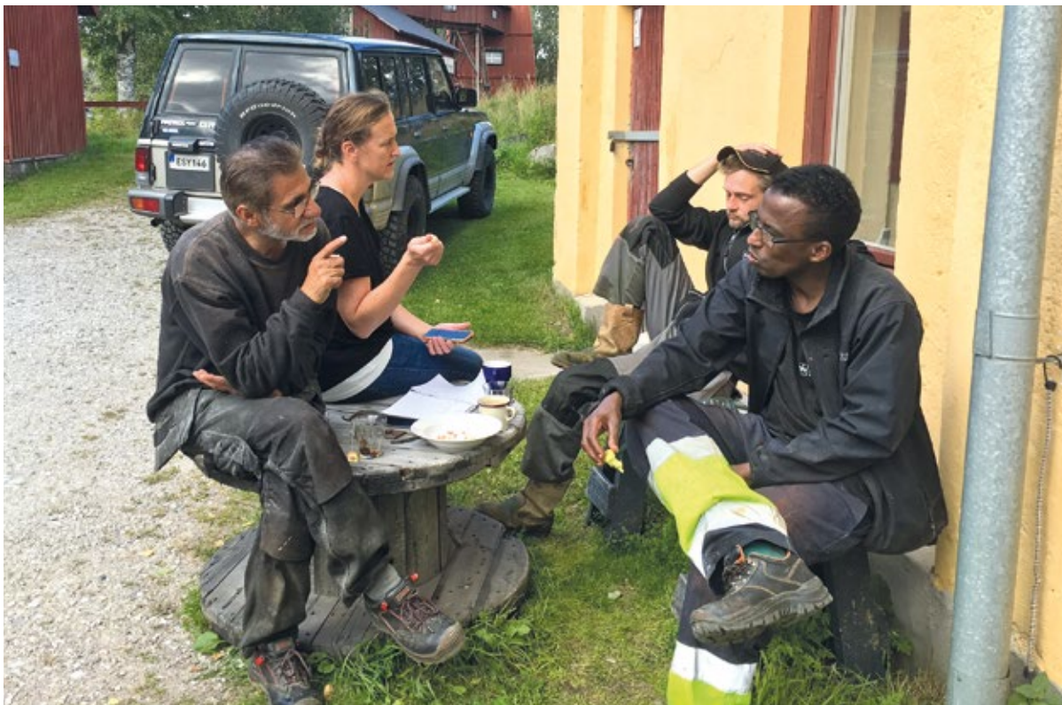
Samtal på rasten.

några hade samma förnamn var det dessutom praktiskt att använda olika benämningar. Vi har också utvecklat ett brett register av hälsningsprocedurer. Kanske kan man säga att vi tillsammans utvecklat en större förmåga till differentierat socialt umgänge. Tiden och vanan att umgås är nyckelkomponenter.