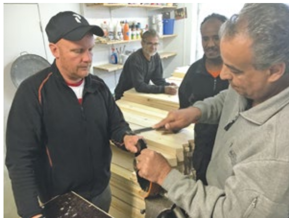
Utflyktsbesökarna är några timmar på Långban, medan yrkespraktikanterna spenderar mellan en dag och flera månader på platsen.

Projektet har visat att kulturmiljön och kulturarvet kan vara en resurs för integration genom: