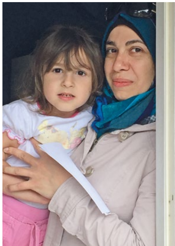
Besökare och volontär under Eid al-fitr med sin dotter.