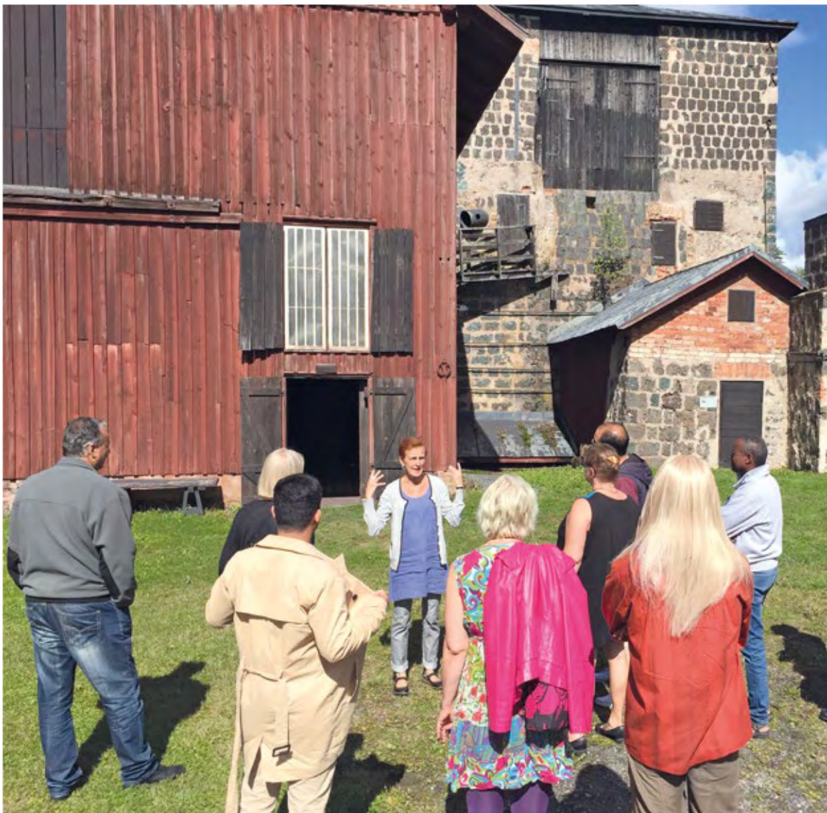
Under sommaren genomfördes guidningar på arabiska och svenska varje lördag.