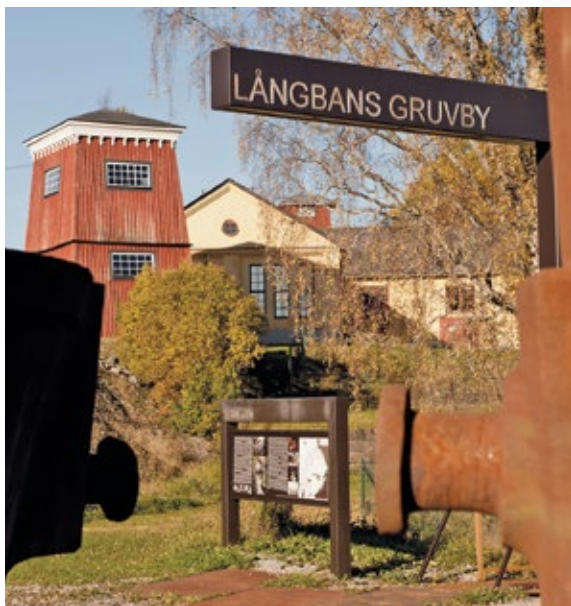
Entrén till Långbans gruv- och kulturby.

I september 2016 gjorde Riksantikvarieämbetets insynsråd ett platsbesök i Långban för att ta del av projektet. Platsen och dess historia presenterades då av Rima Shams-Al-Deen, projektassistent och deltagare i projektet. Detta är hennes manus: