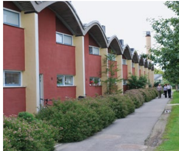
Gyttorp centrum.

Bebyggelsen i Gyttorps centrum uppfördes av Nitroglycerin AB som tjänstebostäder för bolagets anställda. Byggandet skedde i etapper mellan 1949 och 1961. Det är ett komplett bostadsområde med en blandning av radhus och flerfamiljshus jämte lokaler för butiker och annan service. Både samhället och industriföretagen ville här skapa det ”goda folkhemmet” med välfärd för alla. Som arkitekt anlätade bolaget den då relativt okände Ralph Erskine, som 1939 flyttat från England till Sverige. Erskine blev senare en av vårt lands mest framstående arkitekter och är idag ett världsnamn.