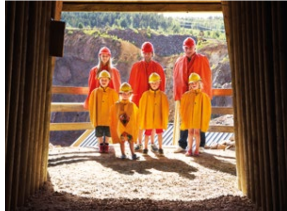
Falu gruva.

Världsarvet Falun består av staden, gruvan och det omgivande bergsmanslandskapet. Falu gruva upphörde 1992 efter mer än 1300 års gruvbrytning. Stiftelsen Stora Kopparberget bildades 1999 och är idag den som äger och förvaltar gruvan. I begreppet Falu gruva inryms besöksgruvan, gruvmuseet, ett Visitor center under namnet Världsarvshuset med en butik samt en mängd byggnader på gruvområdet. Besöksnäring utvecklas tillsammans med viss tillverkning av olika hantverks-