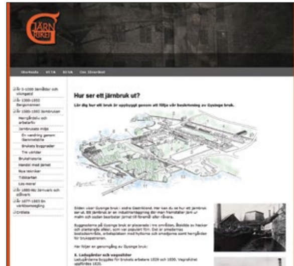
Exempel från skolsidan på Järnrikets hemsida.

Järnrikets webbplats utvecklas kontinuerligt, men grundkonceptet är att den har en skolsida med historisk kunskap och en reseguide med fakta om bruken. Skolsidan fungerar som ett stöd i en pedagogik som skapar en nyfikenhet och lust att söka kunskap om den lokala historien. På webbplatsens reseguide finns information om järnets historia på ett trettioåttio olika platser.