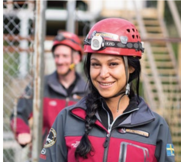
Äventyrsgruvan i Tuna-Hästberg.

I Tuna-Hästberg söder om Borlänge har gruvbrytning av järnmalm förekommit från 1400-talet, fram till den slutliga nedläggningen 1968. Äventyrsgruvan invigdes år 2011. Gruvan har tillgängliggjorts och verksamheten drivs som en ekonomisk förening. Genom att platsen utvecklas som ett besöksmål för internationell publik har den kommit till användning för utveckling av det före detta gruvssamhället.