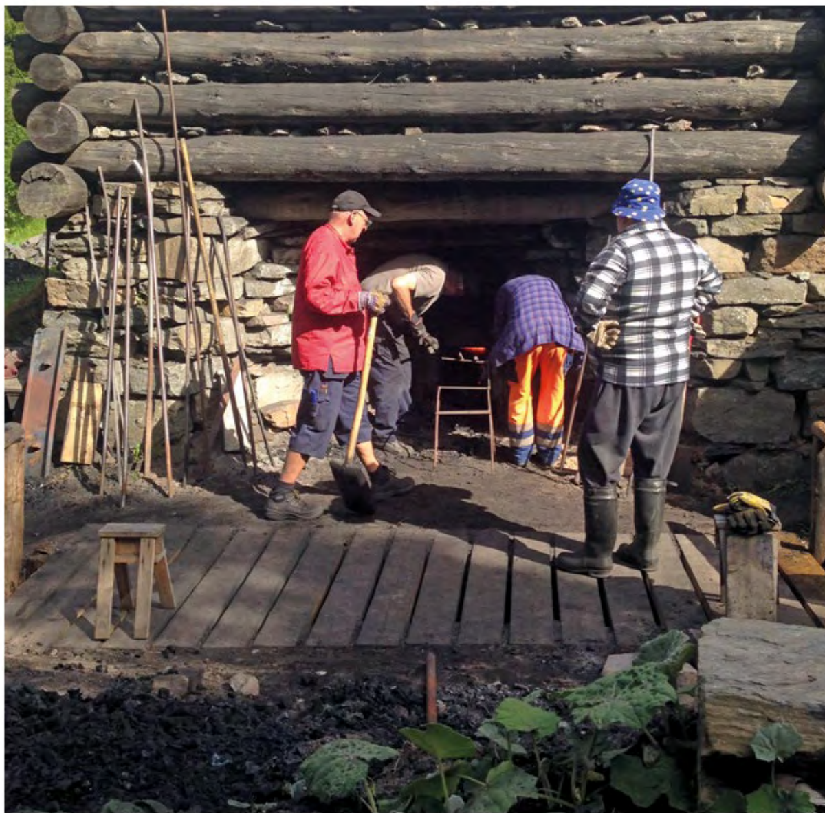
Försök till järnframställning i den rekonstruerade masugnen i Nya Lapphyttan.