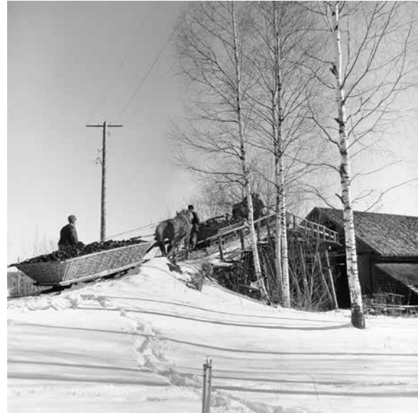
Järnboås järnbruk på 1940-talet.

Järnboås socken bildades omkring 1660 genom en utbrytning ur Nora socken. Järnboåsbygden är ett samlingsnamn för ett antal byar och bjuder på en fantastisk natur och ett sprudlande förenings-, kultur- och företagsliv. Trakten har under lång tid präglats av järnhantering, men bergsbruket upphörde redan på 1800-talet.