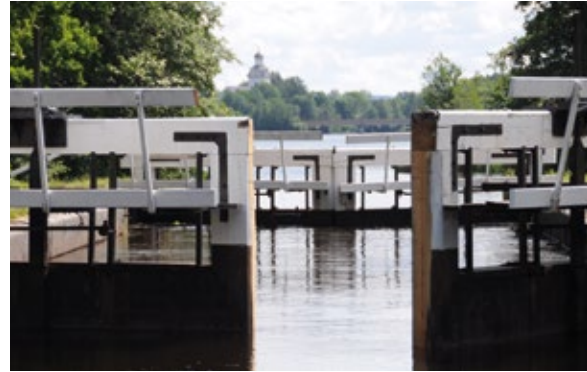
Strömsholms kanal, som är en del av Ekomuseet, byggdes för att forsla järn från bruken i Bergslagen till Mälaren.

Ekomuseum Bergslagen är sedan 1986 ett nätverk av cirka 60 olika industrihistoriska besöksmål. Det handlar om hyttplatser, besöksgruvor, hembygdsgårdar, museer, bergsmansgårdar, smedjor och herrgårdar m.m. Stiftelsen Ekomuseum Bergslagen består av länmuseer och kommuner som 1990 beslutade att samverka kring