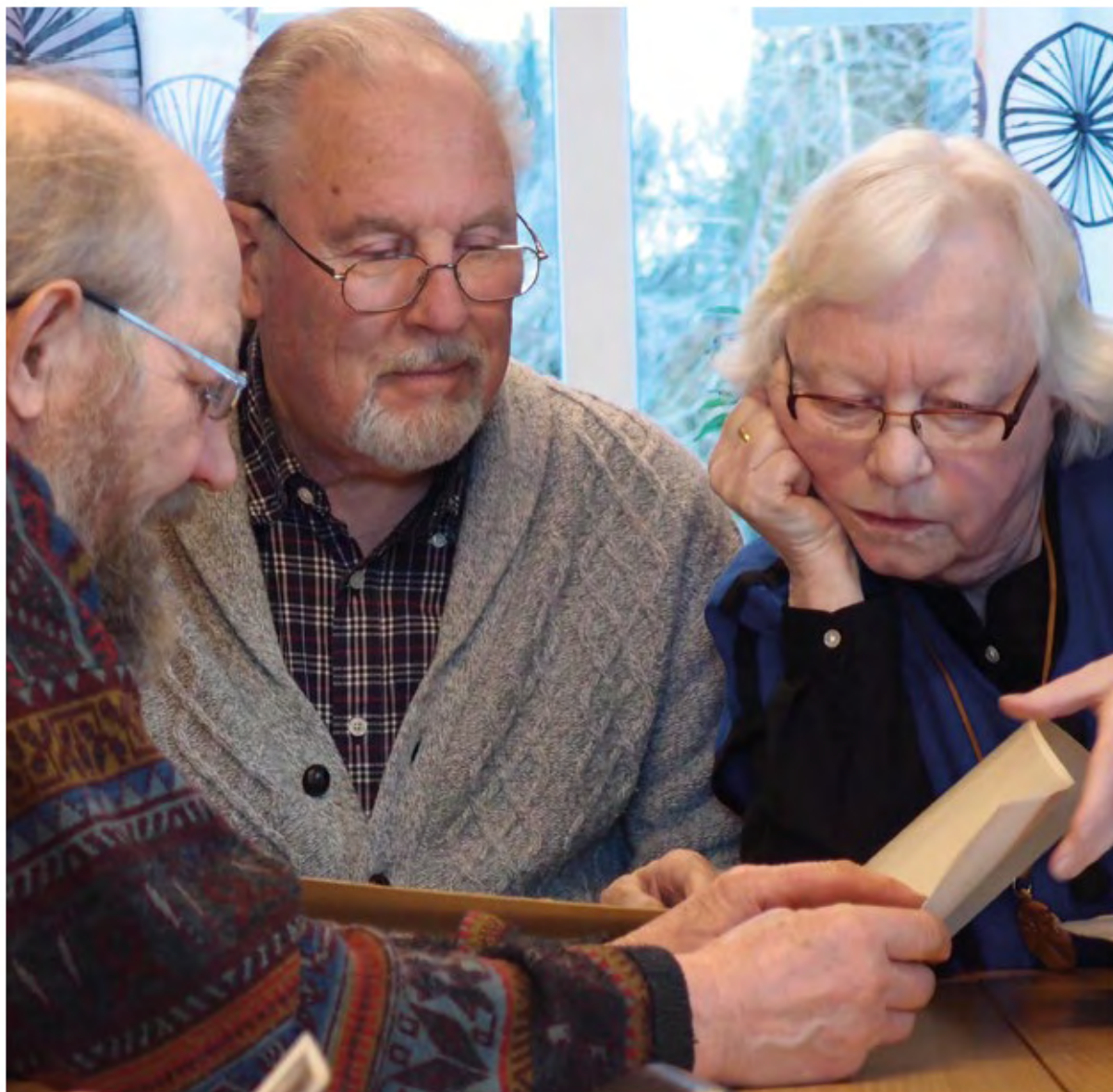
Studiecirkel i Järnboås.