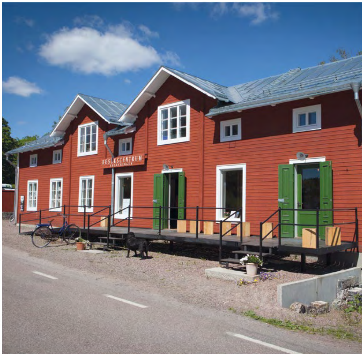
Husbyringens besökscentrum i Stjärnsund.