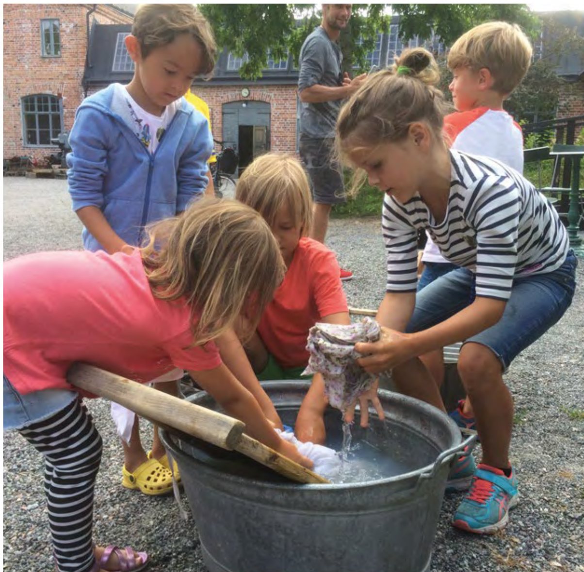
Barn på Pythagoras industrimuseum.