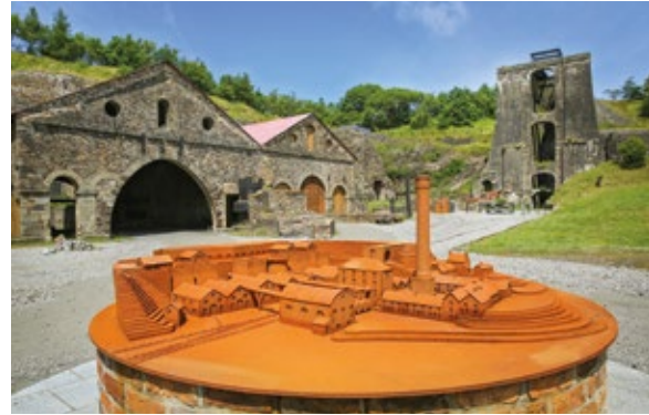
Blaenavon's järnbruk.

En av kulturmiljöerna är världsarvet Blaenavon's järnbruk. Det står i centrum för Wales industrihistoria, och var i drift från 1789 till 1900. Cadw har ett samlat interpretationsmål för att förmedla platsens känsla, mål för kunskapsförmedling, mål för att fånga besökarna till att lägga tillräckligt med tid på besöksmålet och slutligen mål för att marknadsföra andra besöksmål som