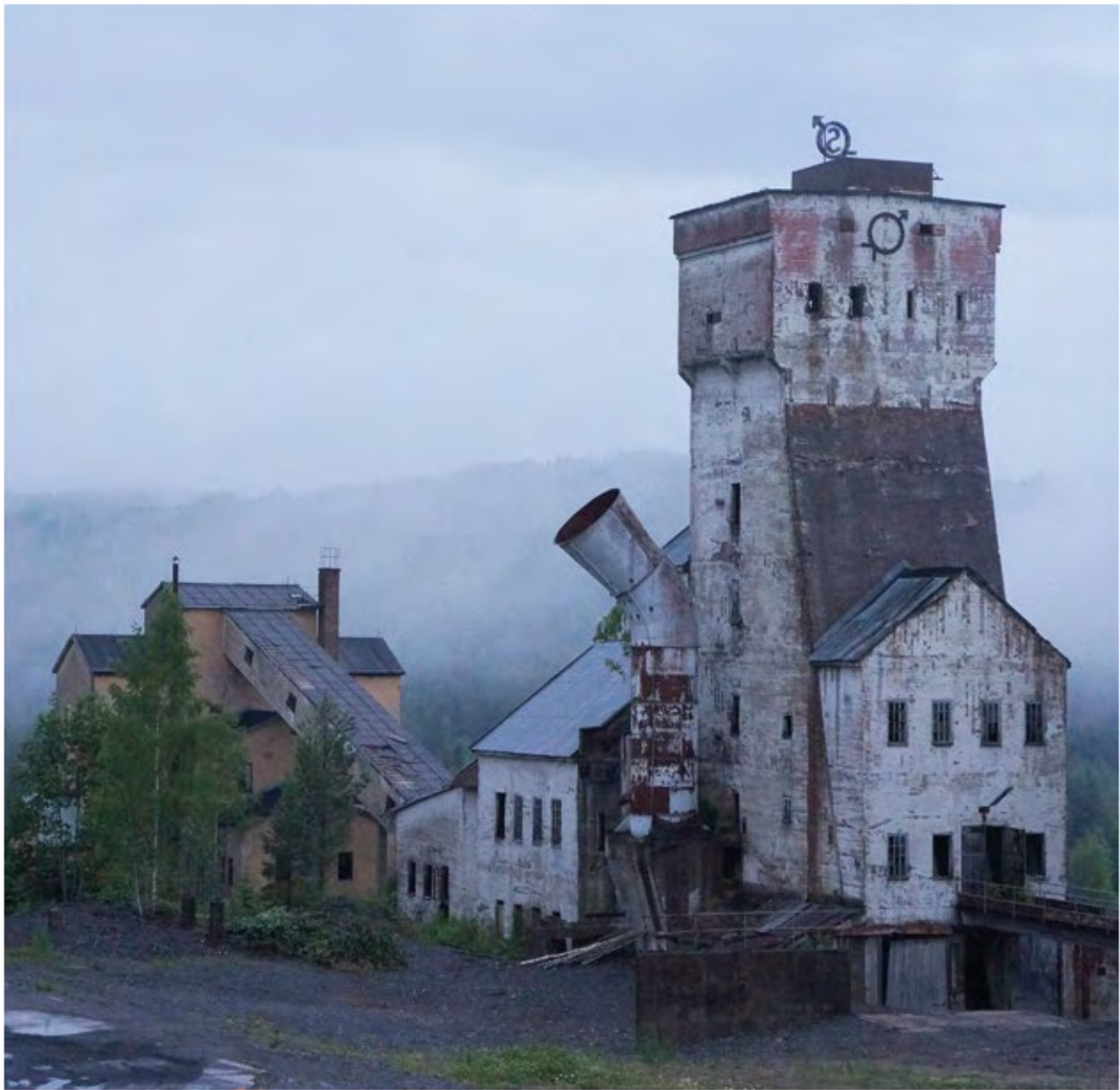
Ställbergs gruvlave.