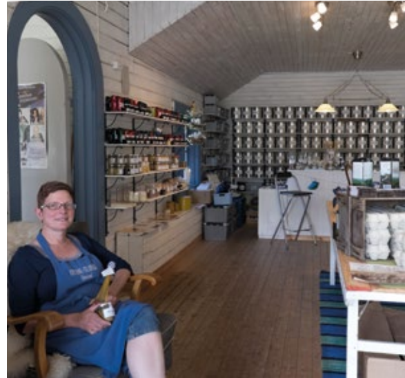
Kryddboden i Stjärnsund, Husbyringen.

Husbyringen är Sveriges första ekomuseum och ligger i Hedemora Kommun. Runt Husbyringens 6 mil långa natur- och kulturlid kan man uppleva en mångfald av kulturhistoriska platser med anknytning till bergsbruket. Husbyringen är inte bara gruvor, hyttor och herrgårdar, utan besöksnäringen använder hela landskapet som museum. Olika platser, flera dussin entreprenörer och många småskaliga verksamheter samverkar på ett kompletterande sätt.