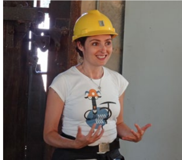
Guide vid Carbonia gruvmuseum.

Kolgruvan Serbariu i Carbonia var aktiv 1937–1964, och präglade ekonomin i hela södra Sardinien. Gruvan var på 1930- till 1950-talen en av de viktigaste energiresurserna i Italien. Projektet ”Landskapsmaskinen”, syftade till att restaurera ett omfattande modernistiskt stads- och gruvlandskap som varit kraftigt miljöförstört, delvis med olaglig dumpning och vanvård efter gruvans slutliga stängning 1971. Gruvkomplexet rustades upp och omformades till ett museum år 2006, ”Museo del Carbone”. I en underjordisk del av