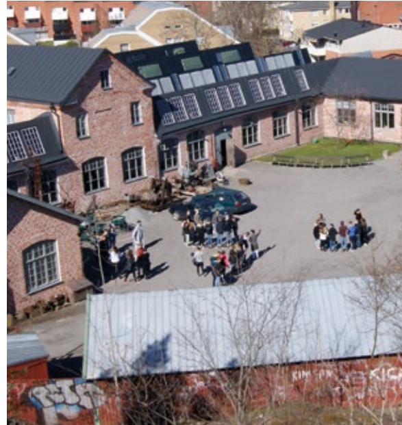
Pythagoras industrimuseum.

Pythagoras industrimuseum utgörs av den gamla motorfabriken Pythagoras i Norrtälje. Här tillverkades tändkulemotorer från 1898 fram till företagets nedläggning 1979. Pythagoras är ett industriminne som i stort sett fungerar som på den tiden då produktion och kontor var i full drift. När eleverna kommer till Pythagoras möter de samma miljö som de unga lärlingar som började arbeta på fabriken efter folkskolan under tidigt 1900-tal. I doften av järn och olja kan besökarna uppleva Sveriges utveckling till industrialisation.