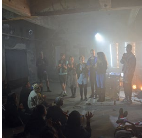
Föreställning i Ställbergs gruva.

Ställbergs gruva med brytning av järnmalm var i drift från 1867 till 1977. Den var under lång tid Sveriges djupaste, med sina 1000 meter. Verksamheten drivs sedan 2012 av föreningen The non existent Center (TNEC), en konstnärsgrupp som ägnar sig åt samtidens samhällsfrågor med perspektiv på centrum och periferi, stad och landsbygd, kulturarv, ekonomi, migration, miljö, klimat och återbruk. I gruppen finns höga ambitioner och konstnärlig spjutspets.