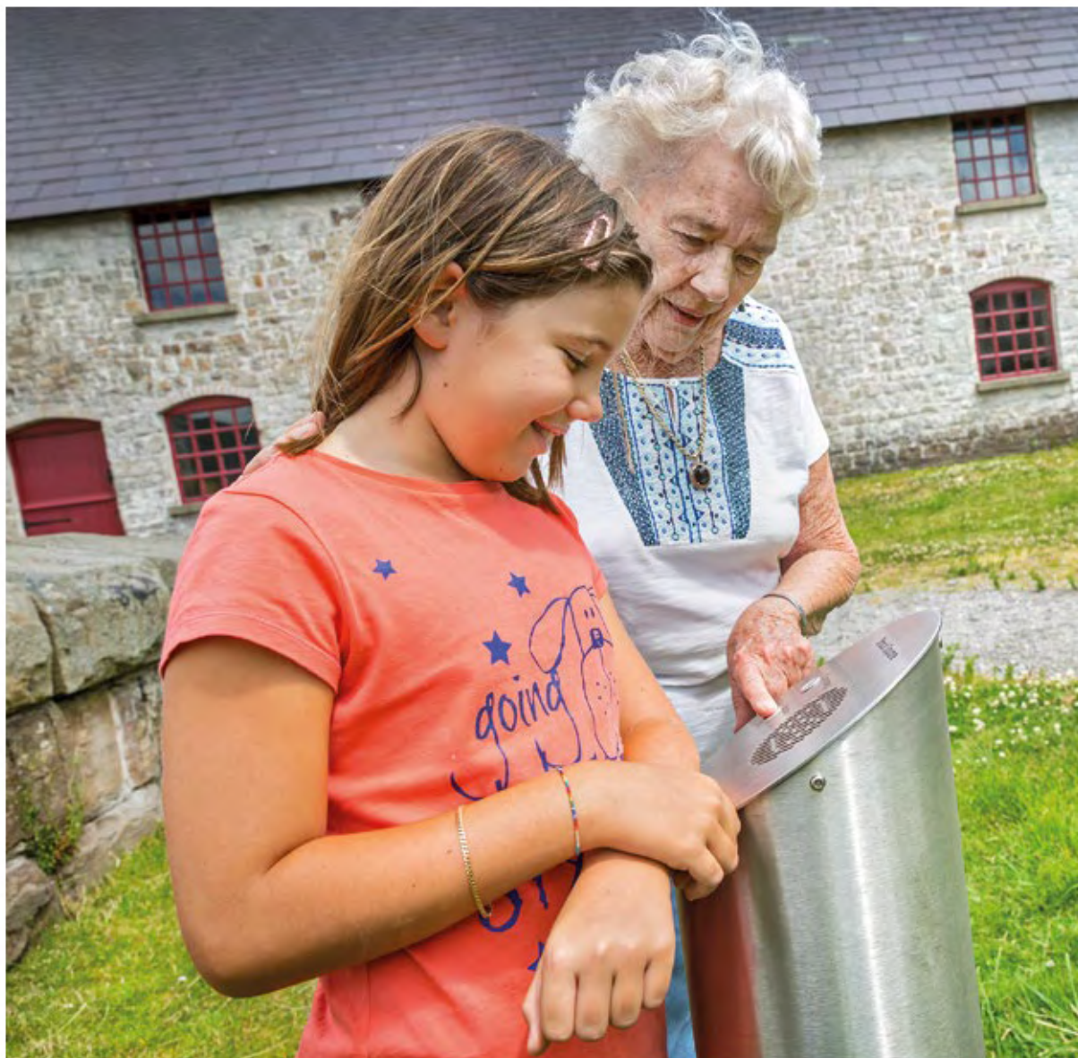
Besökare vid Blaenavon järnbruk.