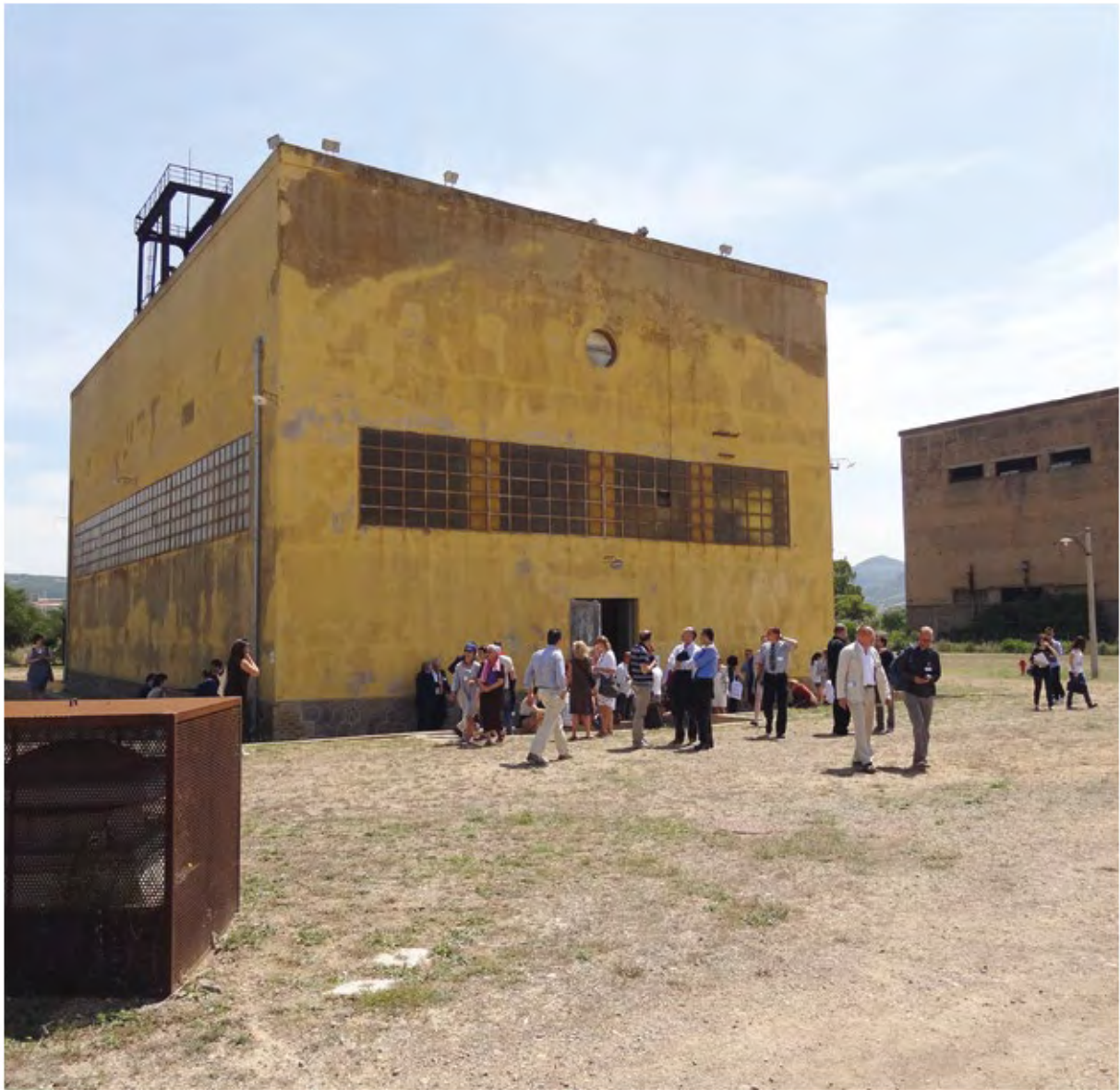
Besökare vid Carbonia gruvmuseum.