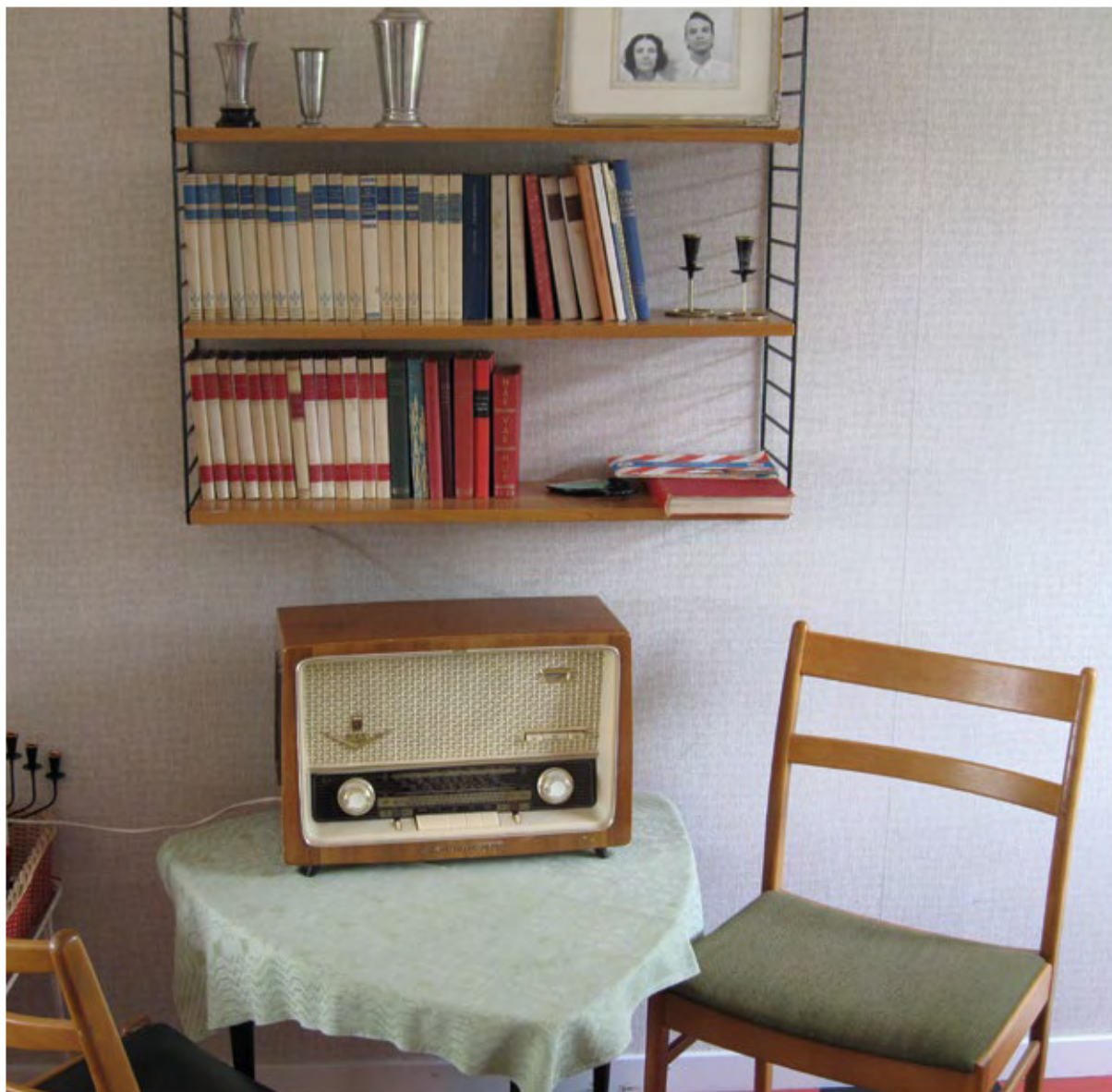
Visningslägenhet i Gyttorp centrum.