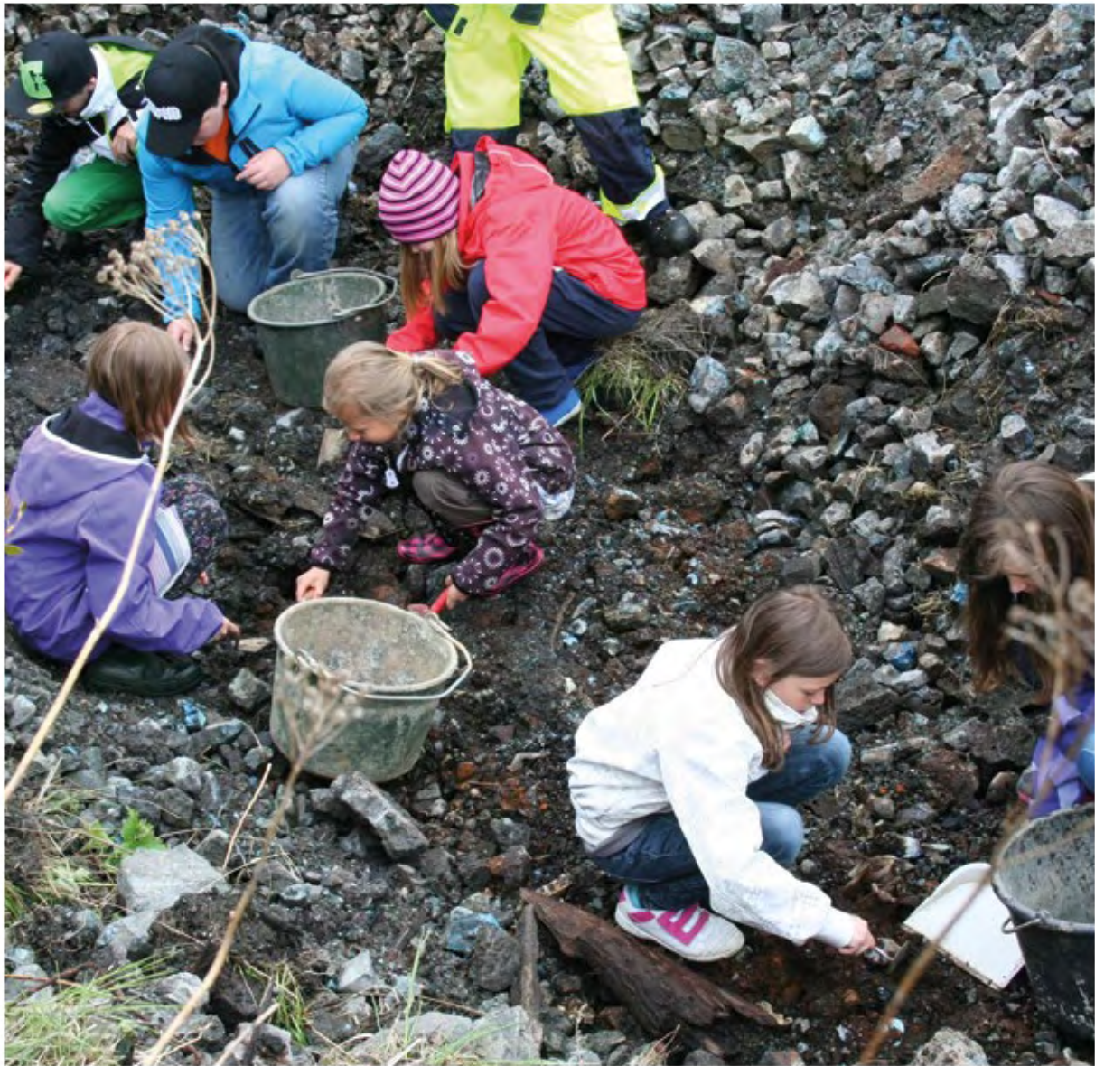
Skolbarn på slagghög vid Axmars bruk.