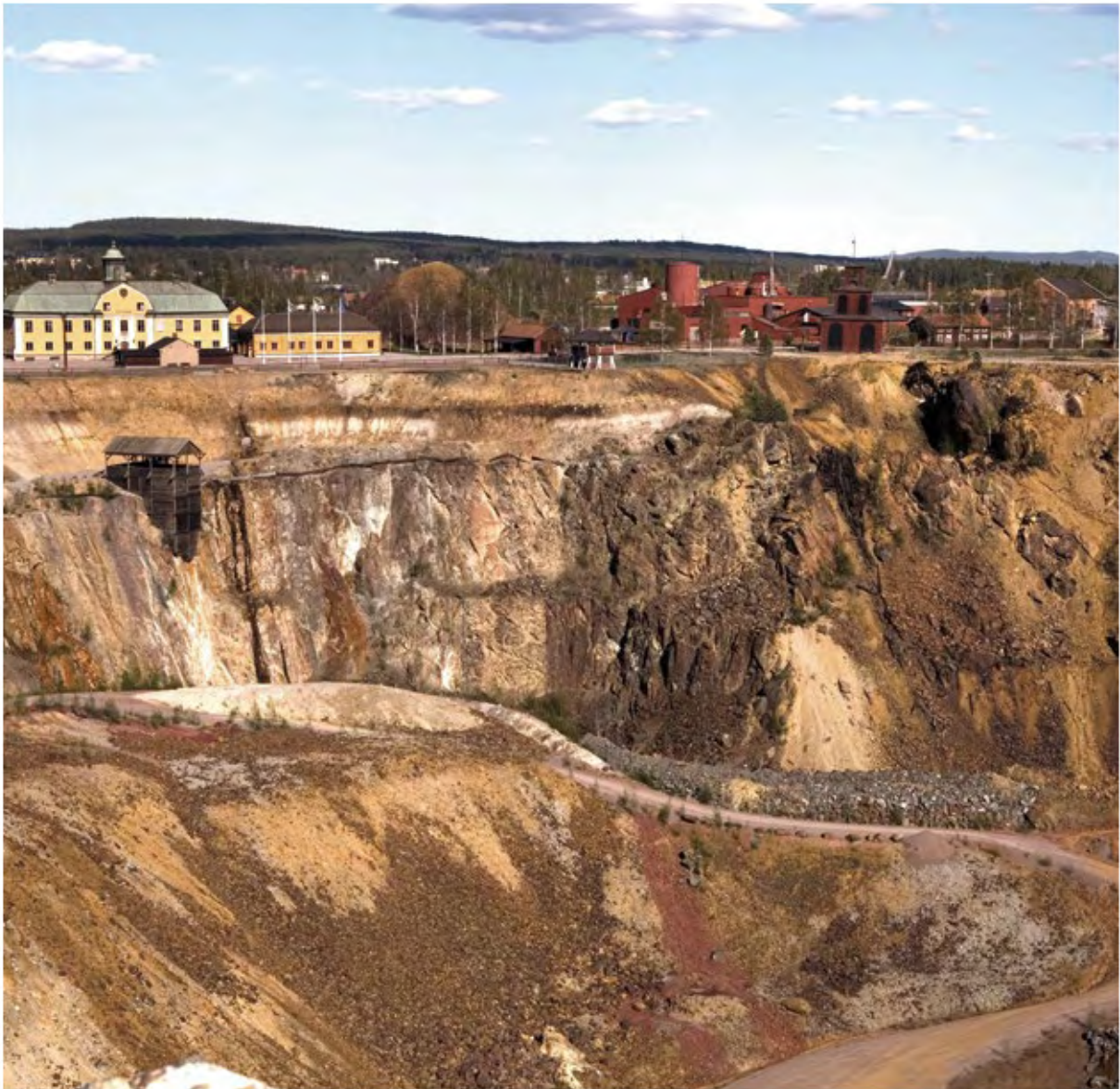
Falu gruva med Stora stöten.