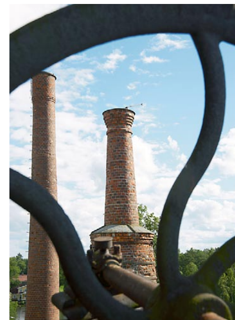
Forsbacka bruk, Valby sn, Gästrikland.

I portalparagrafen till kulturminneslagen fastslås att det är ”en nationell angelägenhet att skydda och vårda vår kulturmiljö” och att ansvaret delas av alla. Det är landets länsstyrelser som sedan mitten av 1970-talet står för den regionala tillsynen över kulturmiljön, dock alltså under överinseende av Riksantikvarieämbetet. Ansvaret för kyrkliga kulturminnen delas liksom före skiljandet år 2000 mellan staten och Svenska kyrkan. Separationen innebar dock vissa förändringar i kultur-