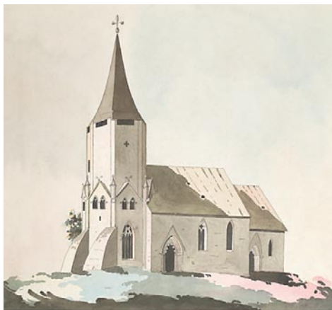
Lärbo kyrka på Gotland. Akvarellerad teckning från 1816–1830 av lantmätaren Lars Cedergren. Riksantikvarieämbetets arkiv.

I förordningen angavs vidare att gamla mynt och föremål av ”guld, silfver, koppar, metall, sten, trä, eller andre konststycken” skulle hembjudas åt staten och att inventarier i landets kyrkor skulle dokumenteras. De senare fick heller inte avyttras utan akademiens godkännande. Kännedom om förordningen skulle allmänheten få genom att den i ”april månad hwartantat år i rikets kyrkor upläses”. Ansvaret för att förordningen efterlevdes ålades landets befallningshavare, konsistorier, präster och kronobetjänter. Bedömningen huruvida åtal skulle väckas om någon överträtt lagen vilade på riksantikvarien själv.