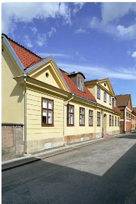
Zachauska gården i Mariestad i Västergötland, en borggård från 1700-talet. Byggnadsminne 1980, tidigare skyddad enligt 1942 års lag.

ägarens godkännande. För att effektivisera skyddet skulle ett register över samtliga byggnadsminnen upprättas – dessa uppgifter ingår idag i Riksantikvarieämbetets Bebyggelseregister. Därtill skulle skyddsföreskrifter för varje enskild byggnad utfärdas. Samtidigt sökte man undvika att ägaren pålades allt för stora praktiska uppgifter och ekonomiska utgifter. Om nyttjanderätten blev för inskränkt och fastighetsvärdet på grund av omständigheterna minskade skulle ägaren kunna räkna med en viss ekonomisk ersättning.