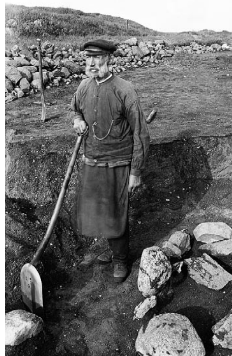
Under 1800-talet infördes kravet på tillstånd för att få genomföra en arkeologisk undersökning. Foto från utgrävning 1912 av järnåldersgravfält vid Smörkullen i Alvastra, Östergötland.

I den hembudsplikt som ingick kunde man läsa att staten vid sidan av guld- och silverföremål hade rätt att lösa in bronsföremål till sina samlingar på Historiska museet. Till saken hör att bronsföremål var mycket