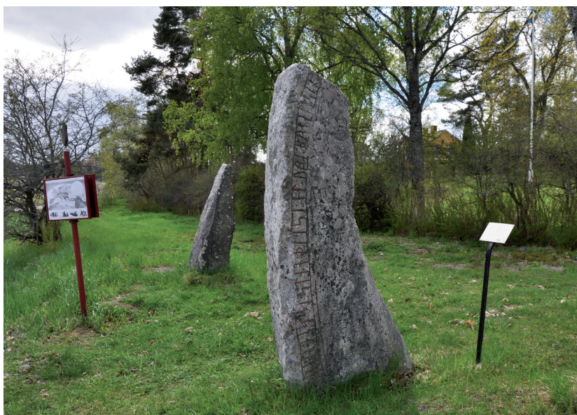
Bild: Runsten Sö 137 Aspa bro, Södermanland.

Proceduren för att bli volontär med uppgift att övervaka och vårda en viss runsten, inleds med en intresseanmälan till Riksantikvarieämbetet. Finns ett lämpligt objekt och båda parter är överens om uppdraget, så upprättas ett avtal mellan Riksantikvarieämbetet och volontären/runstensfaddern. I detta anges bland annat att faddern ska besöka sin sten ett par gånger om året, tvätta den i ljummet vatten med en mjuk borste, röja sly och högt gräs runt stenen, samt årligen inkomma med en statusrapport om stenens kondition. Tanken är att genom tvätt och skötseln av runstenarna hjälpa till att förebygga vittringsskador, samt att synliggöra runstenarna i landskapet. Huruvida det är lämpligt eller ej att stenarna tvättas på detta sätt har under senare år varit omdiskuterat. Risken är att skador istället kan förvärras och enligt nya rekommendationer bör istället volontärerna inrikta sig på tillsyn men inte själva utföra rengöring.