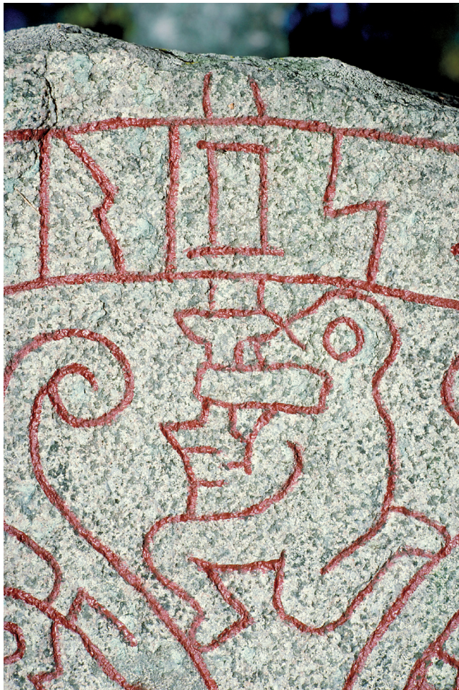
Bild: Runsten U1163 Drävle, Altuna socken i Uppland. Deltalj av runstenen, en bildframställning ur Sigurdssagan.

kan kopplas till en utbredd men felaktig föreställning om att vi egentligen inte kan få någon vederhäftig kunskap om äldre tider, ett förhållningsätt som hör samman med den starka postmoderna strömning som under ett par decennier, fram till de allra senaste åren, dominerade delar av svensk kulturhistorisk forskning och kulturarvstänkande. Under denna tid ifrågasattes äldre expertkunskap, ibland på goda grunder, men tyvärr lika ofta på bekostnad av noggrann och professionell forskning och historieskrivning. Objektiva fakta ansågs inte längre eftersträvansvärda, medan det subjektiva och självupplevda upphöjdes. Utredarens uppfattning är att detta bäddade för en historielöshet och därmed också en aningslöshet och brist på motståndskraft mot ett populistiskt användande av historiska symboler.