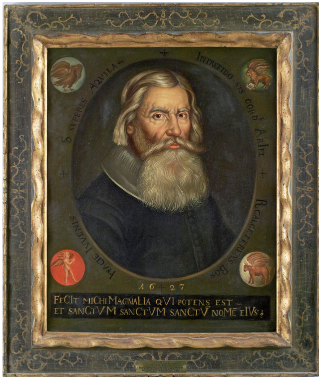
Bild: Målning föreställande Sveriges förste riksantikvarie Johannes Bureus som tjänstgjorde från 1630 till 1649.