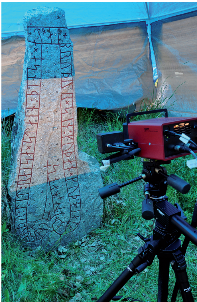
Bild: Runsten Sö 184 Årby, Mariefred. Stenen 3D-skannas av Riksantikvarieämbetet i maj 2011.

av uppgifter som handläggare. En fortsättning med nya innehavare av postdoktorala tjänster vore mycket angeläget även i framtiden. En dialog med de externa finansiärerna kring sådana möjligheter bör därför inledas så snart som möjligt. Utredaren har vid samtal med företrädare för Vitterhetsakademien fått positiva signaler om viljan att diskutera detta.