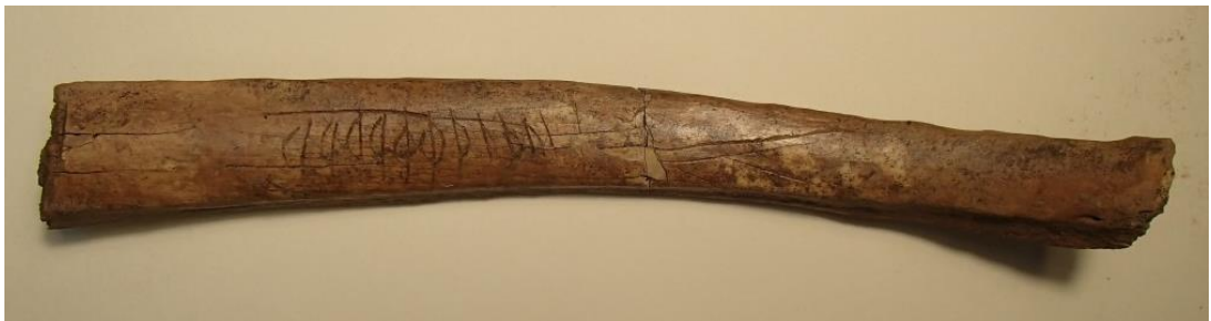
Fig. 1. Det nyfunna runbenet från kv. Humlegården.

Benet har fyndnummer 2 och kommer från ett lager som enligt Ros preliminärt kan dateras till 1000-talet (sektion 1, lager 4).