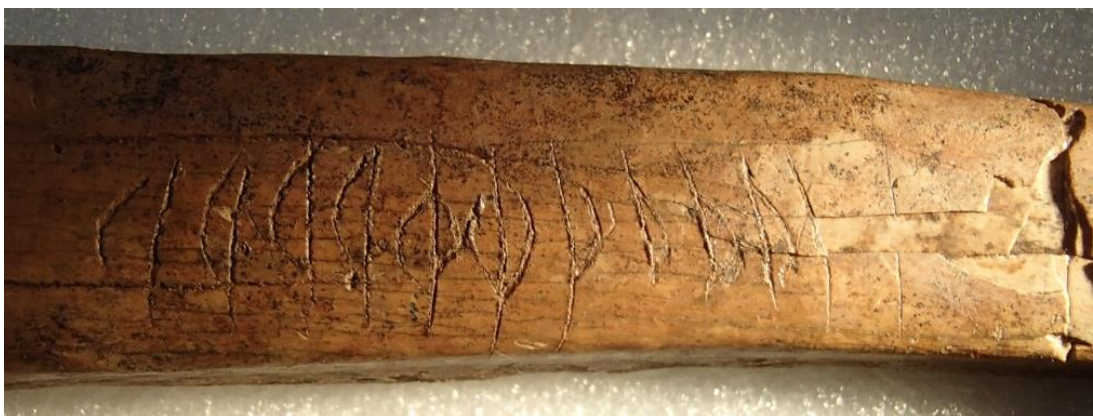
Fig. 2. Detalj av inskriften med benets bredare ände vänd åt vänster.

Inskriften finns på ett revben, som är 175 mm långt, 17–23 mm brett och 10–12 mm tjockt. Runorna är ristade på den konkava sidan av benet och inskriften står 35 mm från den bredare änden. Brottet går strax till höger om ristningen. Inskriften är 49 mm lång och består av 10–13 mm höga runor.