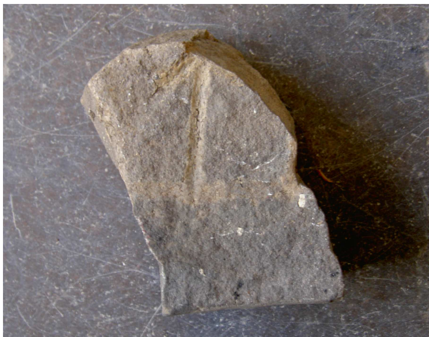
Fig. 2. Sandstensfragmentet fyndnr 21531 från Kv. Professorn 1, Sigtuna. Foto Magnus Källström 2011.

Till läsningen: Av runa 1 återstår den nedre delen av en bistav till en u-run, som följer brottkanten. 3 t är nästan fullständigt bevarad, men den högra bistaven ligger i den högra brottkanten på fragmentet. Runan bör ha varit ca 5 cm hög. Av runa 3 återstår 1,5 cm av en huvudstav precis i brottkanten.