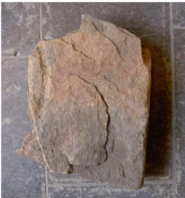
Fig. 3. Sandstensfragmentet fyndnr 43699 från Kv. Professorn 1, Sigtuna. Foto Magnus Källström 2011.

Röd skiktad sandsten. Storlek: 19 x 23 cm. Tjocklek: 5 cm. Den ena sidan är rak och utgör förmodligen stenens ursprungliga kant. Vid den motsatta brottkanten finns rester av en 3 cm bred böjd ornamentslinga. Ristningen är utförd med breda (10 mm) och ganska flacka ristningslinjer.