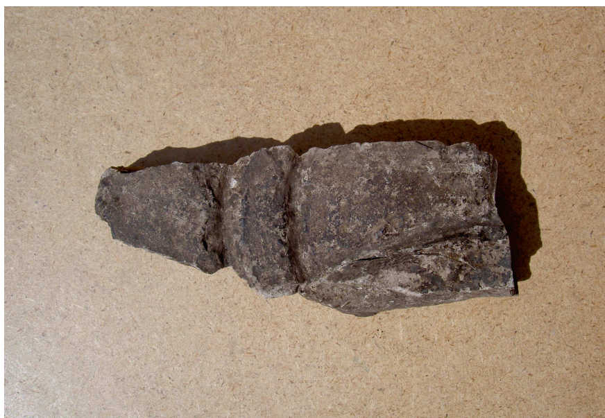
Fig. 1. Kalkstensfragmentet fyndnr 3778 från Kv. Professorn 1, Sigtuna.

Grå kalksten. Storlek: 13 × 4,5 cm. Tjocklek: 2–3 cm. Ristningsytan är mycket slät, medan baksidan är rå. Ristningen är djupt huggen med 7 mm breda ristningslinjer och utgörs av två korsande ornamentsslingor av runstenskaraktär. På ristningsytan finns en del av missfärgningar, och det kan vara värt att undersöka om detta möjligen kan utgöra rester av ursprunglig bemålning.