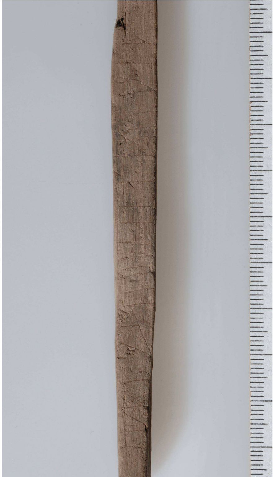
Fig. 4. Detalj av inskriften på sida B.