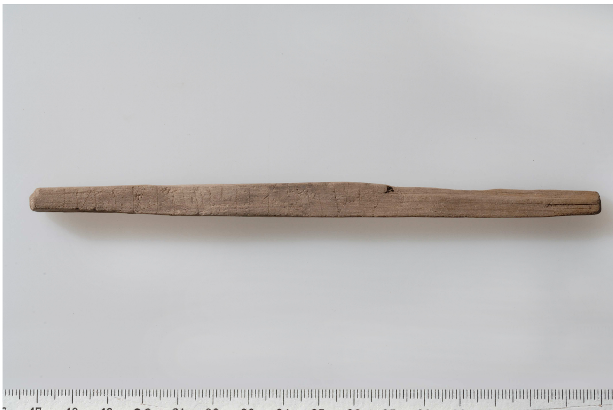
Fig. 2. Baksidan (B) av karvstocken från Kv. Traktören 2, Enköping.

är inte förenad med huvudstaven och tillhör därför snarare den följande runan (runa 10). Runa 10 utgörs av en rak huvudstav som är något skadad i toppen. Om den ovan nämnda bistaven tillhör denna runa bör den läsas som t. Nedtill mellan runa 9 och 10 har ett stycke av ytan fallit ur. Runa 11 är þ med en relativt smal bistav placerad på mitten av huvudstaven. Runa 12 utgörs av en rak huvudstav och skall snarast uppfattas som i. På mitten till höger om huvudstaven finns en kort, ganska svag och något böjd linje, som möjligen kan vara avsedd som en stingning och tyda på att runan skall läsas som e. Den följande runan (13) saknar bistavar och är följaktligen i. Huvudstaven når inte upp till den övre kanten. Runa 14 är skadad i toppen. Runan har en ensidig bistav snett nedåt höger och är alltså n. 15 a har ensidig bistav. Runa 16 är t med ensidig bistav till vänster, som utgår från den övre kanten, 0,5 mm till vänster om huvudstavens topp. Runa 17 utgörs av ett smalt u, där bistaven utgår nedanför toppen i runan. Runan kan inte läsas som r. Runa 18 utgörs av en rak huvudstav utan bistavar och är alltså i. Även runa 19 utgörs av en rak huvudstav, som trots en ytskada på mitten kan följas i hela sin längd. Till vänster om den övre delen av staven finns en trekantig skada, där den vänstra kanten är jämn och möjligen kan utgöra resterna av en bistav snett uppåt vänster. Det är dock mycket tveksamt om detta är rester av ristning. Strax till