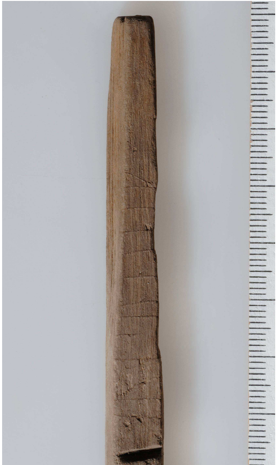
Fig. 3. Detalj av inskriften på sida A. Foto Gabriel Hildebrand/SHM 2011.