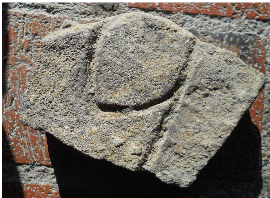
Fig. 1. Ristat sandstensfragment (fyndnr 22526) från Kv. Trädgårdsmästaren 9–10, Sigtuna.

Fragmentet är av röd sandsten och mäter 14 x 10 cm. Tjockleken uppgår till 4 cm. Ristningen är djupt ristat med 6 mm breda linjer. Fragmentet är inte rengjort och kan därför möjligen vara intressant för analys av eventuella spår av ursprunglig bemålning.