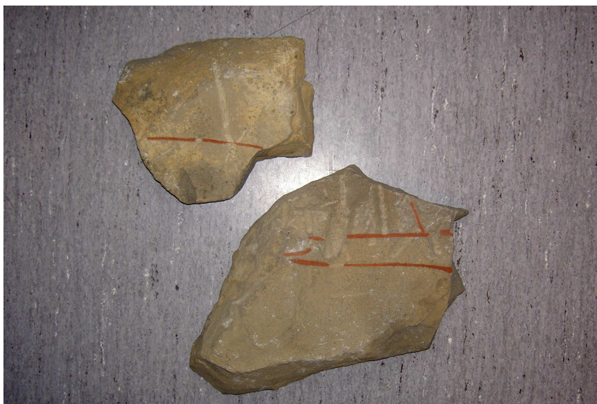
De två fragmenten från Normlösa.

Materialet utgörs av gulgrå sandsten och båda fragmenten har flat baksida och avrundade kanter. Det större fragmentet (här kallat A) mäter 32 x 20 cm och är 6 cm tjockt. Ristningen består av två parallella linjer samt i något sned vinkel mot dessa ytterligare en linje. Ristningslinjerna är relativt smala (3 mm). I vinkel mot de två längre uppmålade linjerna finns djupare spår, 1–2 cm breda spår, som sannolikt har uppkommit genom att stenen sekundärt har använts som slipsten. Det mindre fragmentet (B) mäter 20 x 16 cm och är 3,5 cm tjockt. Ristningen består av en rak linje, 11,5 cm lång och 3 mm bred. Denna skärs i vinkel av ett bredare och flackare spår.