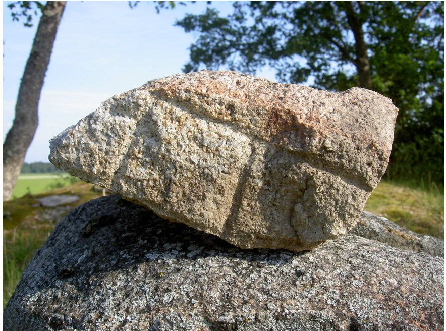
Fig. 3. Detaljbild. Foto Magnus Källström 2011.

Inskriften kan nu återges på följande sätt (jfr M. Källström, Mästare och minnesmärken. Studier kring vikingatida runristare och skriftmiljöer i Norden (2007), s. 407):