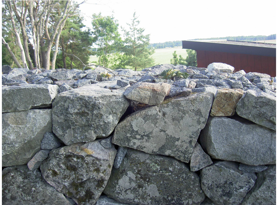
Fig. 2. Samma fragment men vänt. Foto Magnus Källström 2011.

Gråspräcklig granit. Storlek: 19 × 9 cm. Tjocklek: 14–17 cm. Runhöjd: 6 cm.