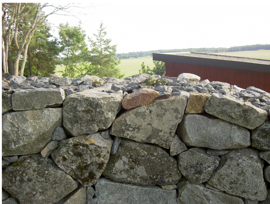
Fig. 1. Fragmentet där det låg i muren. Foto Magnus Källström 2011.

Vid ett tillfälligt besök vid Skånela kyrka den 30 juni i år fick jag en ingivelse att vända på ett litet stenstycke som låg allra överst på insidan av den nyomlagda kyrkogårdsmuren, ca 10 m V om öppningen i muren (fig. 1). På den sida av stenen som hade varit vänd inåt muren uppenbarade sig då ett runband med två tydliga runor (fig. 2–3).