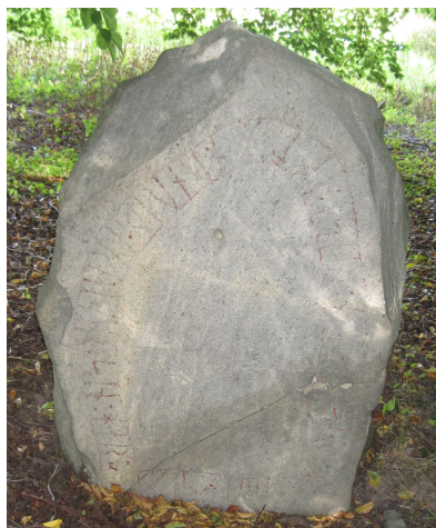
DR 276 Örsjö gård

Stenen står i en igenvuxen del av gårdsparken, nära norra kyrkogårdsmuren. Den uppmålades 1996 men efter rengöringen 2011 återstår inte mycket av den uppmålningen. Det är knappast meningsfullt att måla runorna igen så länge stenen står den vildvuxna parken.