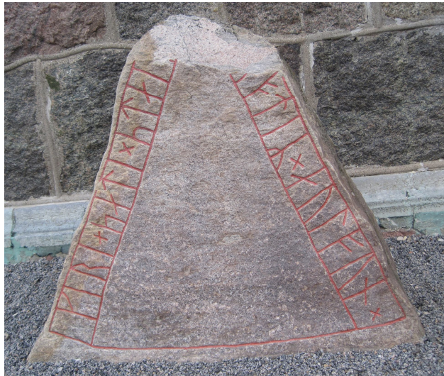
DR 287 Bjäresjö kyrka