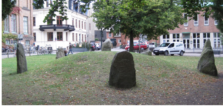
Runstenskullen vid Lundagård

SWEDISH NATIONAL HERITAGE BOARD RIKSANTIKVARIÉÄMBETET