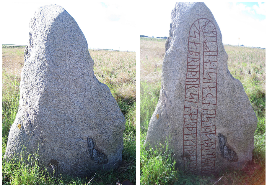
DR 268, Östra Vemmenhögs socken

Stenen står ett par 100 meter öster om kyrkan, nära den gamla landsvägen och den gamla stenbron 'herremansbron'. Den hade inte uppmålats sedan 1977 och i stort sett alla spår av den uppmålningen försvann i samband med rengöringen. Tyvärr är stenen så nedsjunken att nedersta delen av ristningen är under markytan och måste grävas fram inför uppmålningen.