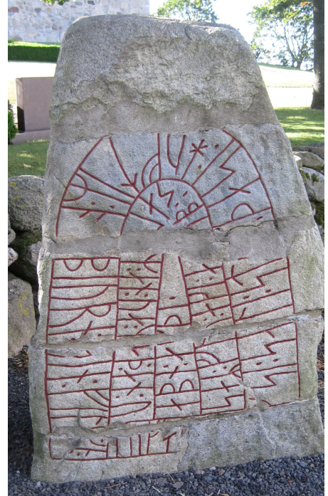
DR 279 Sjörups kyrka