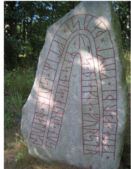
DR 277 Rydsgård