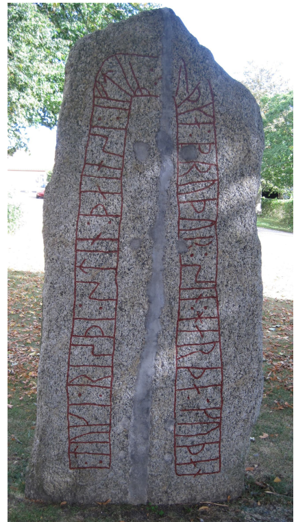
DR 278 Norra Nöbbelövs kyrka