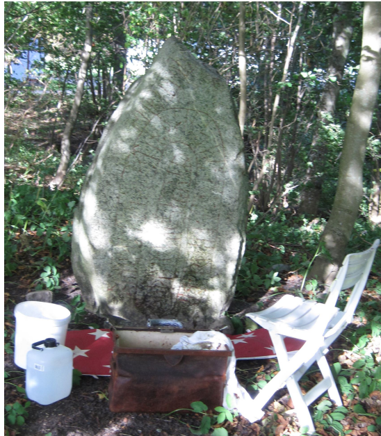
DR 275 Torsjö slott

Stenen står i slottsparken, ett 50-tal meter norr om slottets huvudingång. Den uppmålades 1994 och en hel del färg återstod i ristningslinjerna.