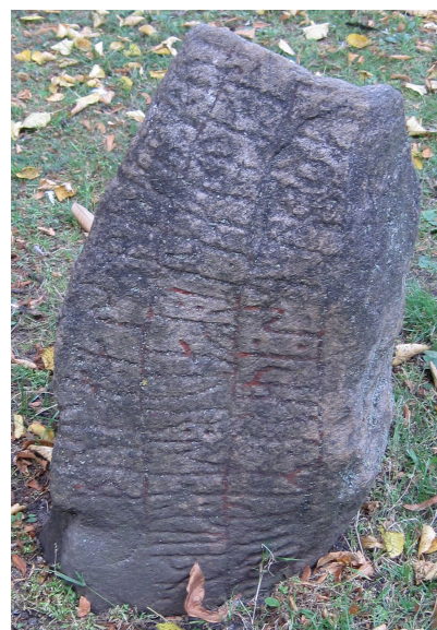
DR 325 och 298 Kulturen i Lund