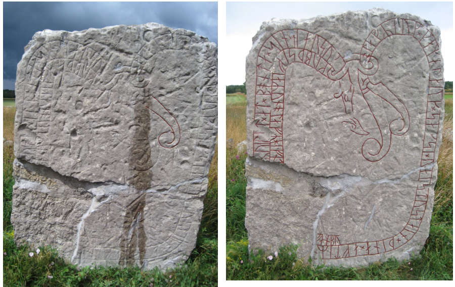
ÖI 37 Lerkaka, Runstens socken