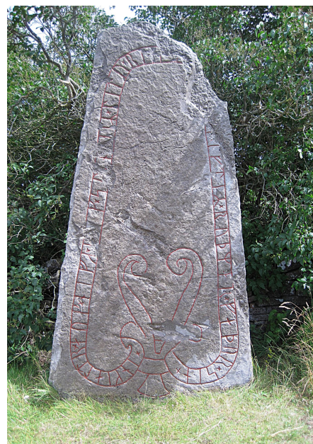
Öl 18, Säby, Segerstads sn

Efter rengöring och översyn av ristningsytan är runstenen i ganska gott skick. Uppmålningen kunde genomföras trots regnskurar. Stenen är välbesökt men saknar tyvärr skylt, vilket borde åtgärdas.