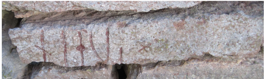
Nf 2004 Köpings kyrka