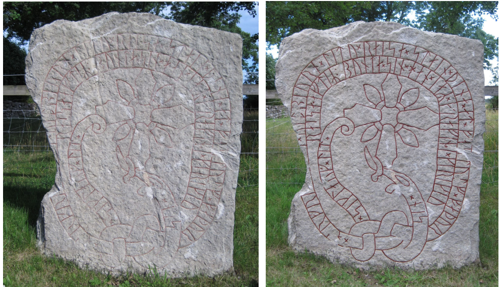
Öl 36 Bjärby, Runstens socken

lagades 2011 och är nu i ganska gott skick. Den graverade skylten, skriven av undertecknad omkring 1980, borde dock bytas ut mot en skylt av modernare typ.