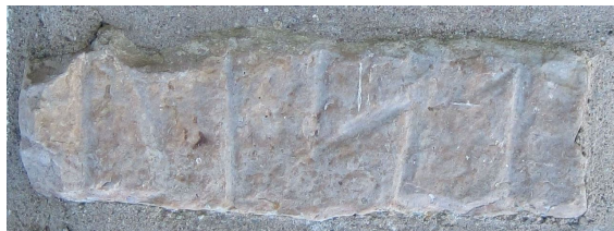
Öl 48 Köpings kyrka

Fragmentet av Öl 48, som återfanns 1972, inmurat i sakristians norra yttermur är rent och skulle kunna uppmålas vid tillfälle. Uppmålningen av nyfyndet 2004 i södra kyrkogårdsmuren börjar nu nötas bort men är fortfarande tydlig. Stenen är tydligen ornamenterad på ovansidan och borde vid tillfälle plockas ut ur muren.