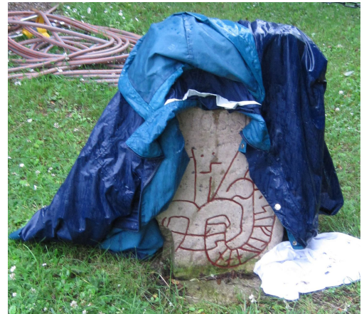
Öl 44 vid Skedemosse gård