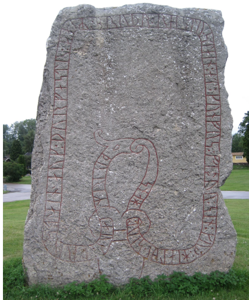
Öl 46, står nära Köpings kyrka

Den mäktiga stenen, som är Ölands högsta och bredaste runsten, uppmålades 1991. Uppmålingen är fortfarande ganska välbevarad men ristningsytan började bli ganska lavbevuxen. Stenen spritbehandlades därför 2011. Denna behandling hade fått en viss effekt ett år senare utom på ristningens nedersta vänstra del. Jag upprepade därför behandlingen på dessa partier.