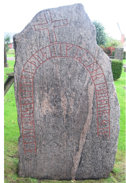
Trots att Vg 100 inte uppmålats på 40 år fanns det ganska mycket färg kvar i runorna efter rengöringen