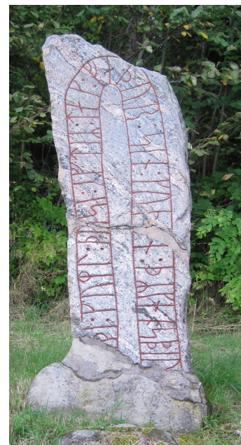
Vg 101 Flo socken, Bragnum