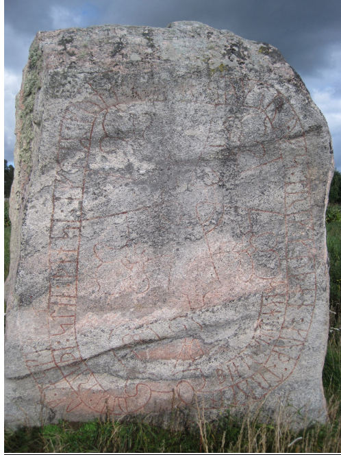
Vg 127 Larvs socken, Larvs hed

Den enorma stenen står nu på en låg holme mitt i en åker och är därför mycket svårtillgänglig stora delar av året. Den uppmålades 1987 men var ganska kraftigt överlavad 2011 då den behandlades med teknisk sprit av stenkonservator Paterik Stocklassa. Vid min granskning i september 2012 var stenens nedre del redan ganska fri från påväxt medan stenen övre del måste nog behandlas ett par gånger till innan ristningsytan är tillräckligt ren för ny uppmålning. Skyltad av hembygdsföreningen.