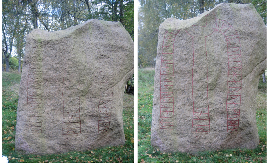
Vg 62 uppmålades med linoljefärg som troligen mörknar med tiden

Runstenen vid Flos kyrka uppmålades senast i oktober 1971 och var ordentligt överlavad vid min granskning sommaren 2010. Den rengjordes 2011 och uppmålades i september 2012. Tyvärr kom ett störtregn precis när jag hade avslutat uppmålningen. Färgen fäste därför inte riktigt i vissa partier. Jag kommer att besöka stenen igen sommaren 2013 för att bättra på färgen i dessa partier. Stenen är skyltad med en urgammal träskylt som borde bytas ut mot en modernare skylt.