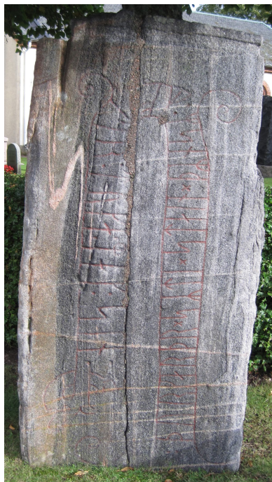
Vg 104 Sals kyrka efter rengöring