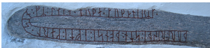
Vg 112 Ås kyrka före och efter uppmålning.

Denna långsmala runsten är inmurad i kyrkans nordöstra kormur, längs stenfoten. Trots att den inte uppmålats sedan 1971 fanns det ganska mycket färg kvar i ristningslinjerna. Den urgamla träskylten borde bytas ut mot en modern skylt.