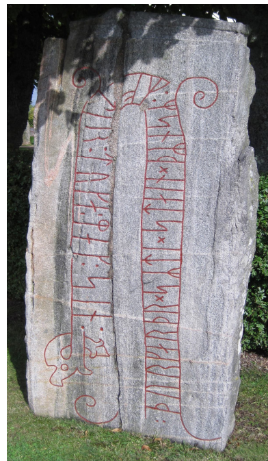
Vg 104 efter uppmålning