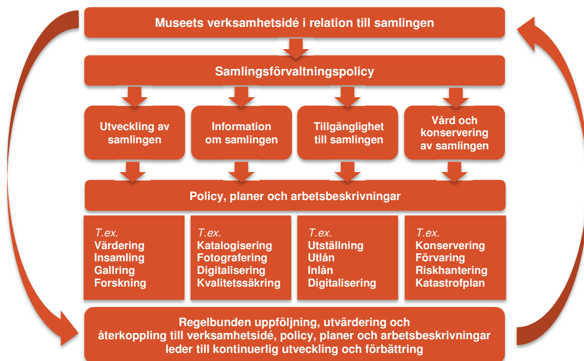
Bild 1. Ramverk för samlingsförvaltning. Bilden utgår från PAS 197: 2009 British Standards Institution.

Samlingsförvaltning är ett begrepp som används för att beskriva en helhetssyn på arbetet med samlingar, där alla inblandade yrkesgrupper arbetar mot samma mål. Syftet är att göra förvaltningen av samlingarna mer ändamålsenlig, effektiv och hållbar. Arbetet omfattar allt från insamling, gallring och vård till dokumentation och informationshantering. I samlingsförvaltningen ingår också att se till att samlingen tillgängliggörs för nutida och framtida generationer. Alla aktiviteter som är relaterade till samlingen är beroende av att man vet vad man har, att objekten är väl dokumenterade, att objekten är i tillräckligt gott skick och att man kan hitta och använda det man söker. Samlingsförvaltning bygger på att man har tydliga riktlinjer, rutiner och rollfördelningar som är kopplade till organisationens mål. Regelbunden uppföljning av dessa ingår som en del av organisationens planering.