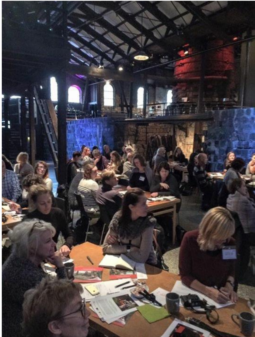
Konferens om interpretation i Avestaverket den 20-21 oktober 2015.