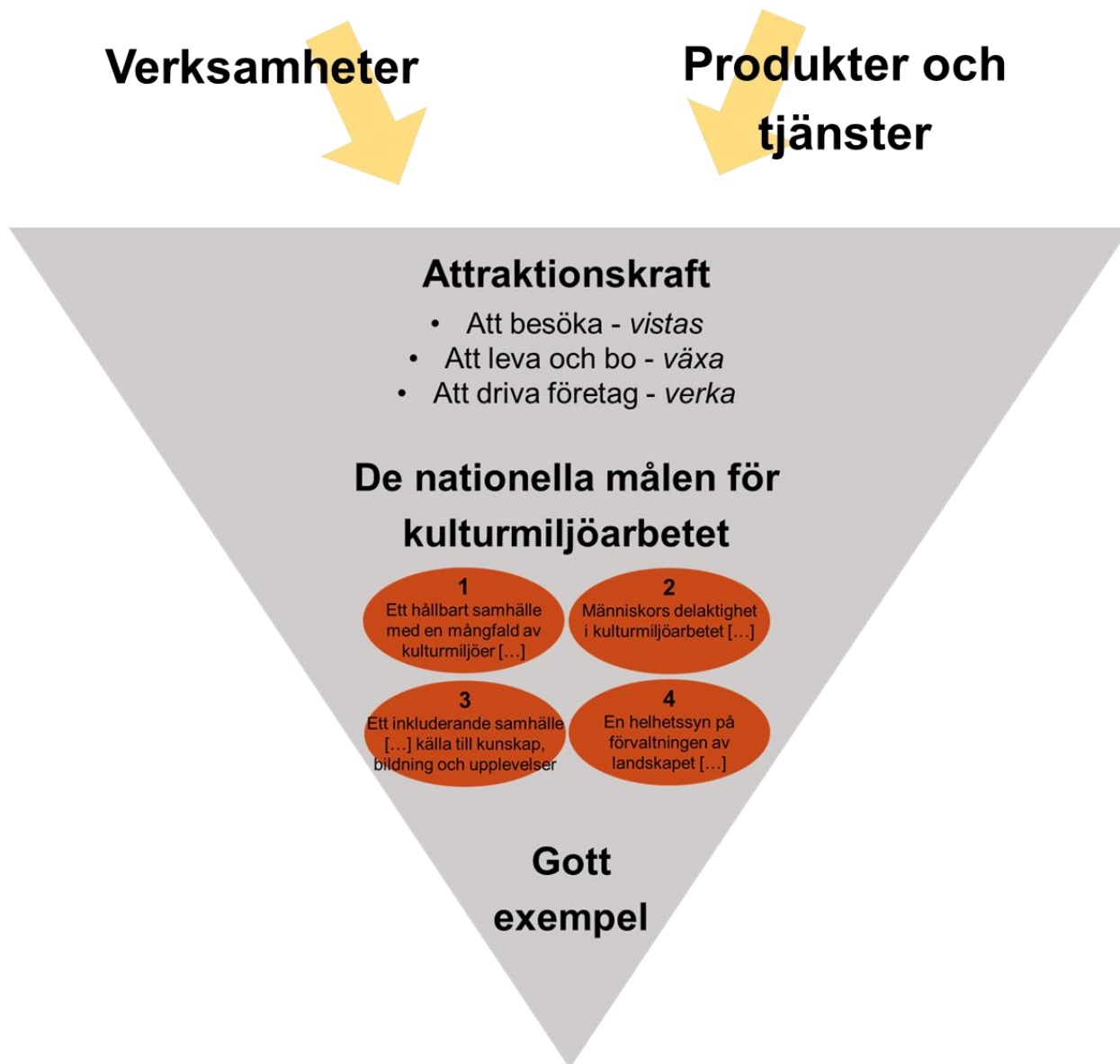
Figur 1. "Det goda exemplet" som det definieras av Riksantikvarieämbetet inom Gruvuppdraget.