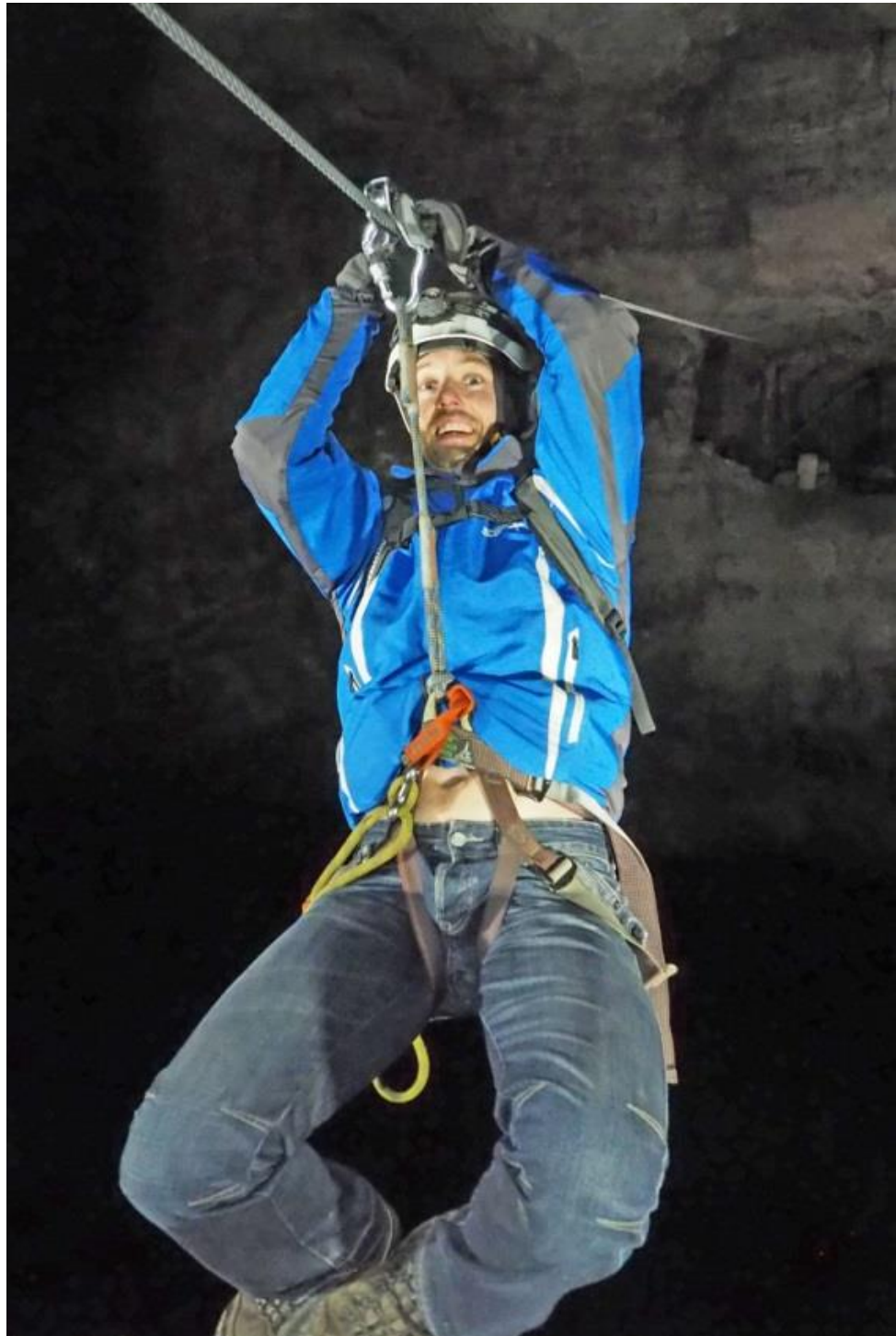
Linbanefärd under äventyrstur i gruvmiljö.