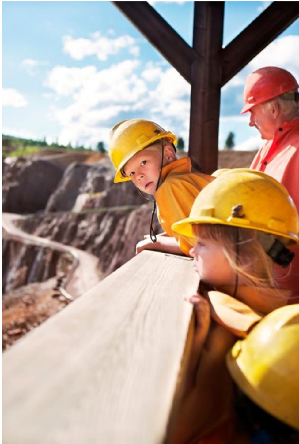
Med utsikt över gruvan.