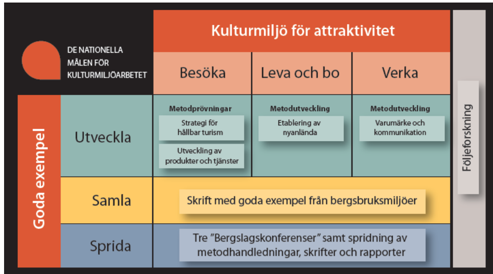
Figur 1. Ramverket för Gruvuppdragets olika delar, samt dess olika delprojekt.

Fem av delprojekten återrapporteras, förutom i denna slutredovisning, också i separata skrifter. Därutöver har ett stort antal leveranser, varav två delrapporter, gjorts inom uppdraget. 2 Delrapport 2 redovisar en fullständig förteckning över leveranserna. Nedan följer en kort presentation av samtliga sju delprojekt.