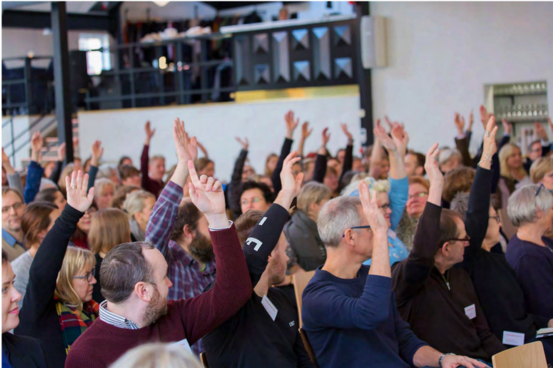
Hur många kommer från ett regionalt museum?