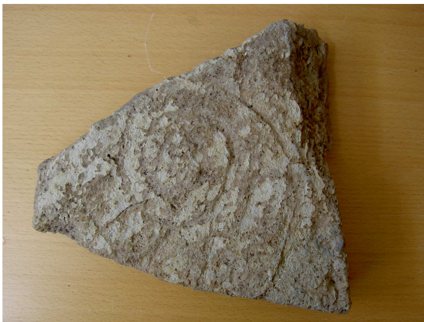
Det nyfunna kalkstensfragmentet från Repslagaregatan vid S:t Lars kyrka, Linköping. Foto Magnus Källström 2011.

Fyndplatsen för det ristade fragmentet låg nära korsningen mellan Repslagaregatan och Storgatan. På samma plats påträffades flera fragment av kalksten, men dessa var så söndervittrade att de föll sönder. Några spår av ristning ska inte ha upptäckts, men på grund av stenarnas dåliga kondition kunde det inte uteslutas att de ursprungligen varit ristade. Det tillvaratagna fragmentet har fyndnummer C4550:57.