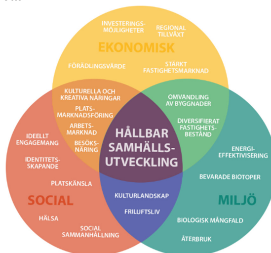
Illustration från Riksantikvarieämbetets rapport Räkna med kulturarvet.

På arenan för hållbar samhällsutveckling möts de som vill bidra till en miljömässigt, socialt och ekonomiskt hållbar utveckling av samhället. Kulturmiljön bidrar på olika sätt till alla dessa tre dimensioner.