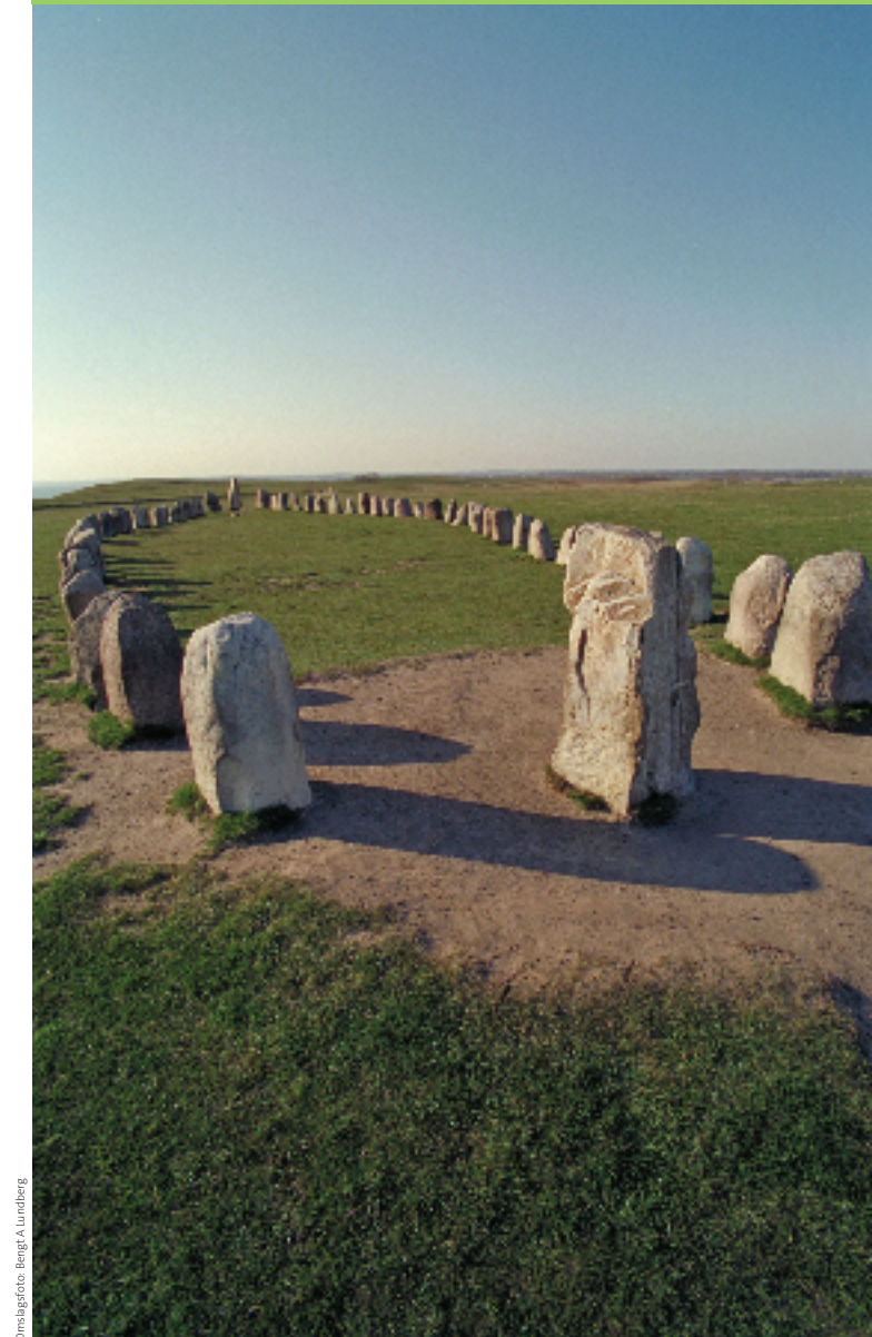
Ortslagfoto: Bengt A. Lundberg

Informationen um geführte Besichtigungen an „Ales stenar“, sowie Kåseberga und die umgebende Natur finden Sie auf der Webseite des schwedischen „Riksantikvarieämbetet“: www.raa.se/alesstenar oder kontaktieren Sie die Touristeninformation in Ystad, Tel.: 0411-57 76 81. E-Mail: turistinfo@ystad.se