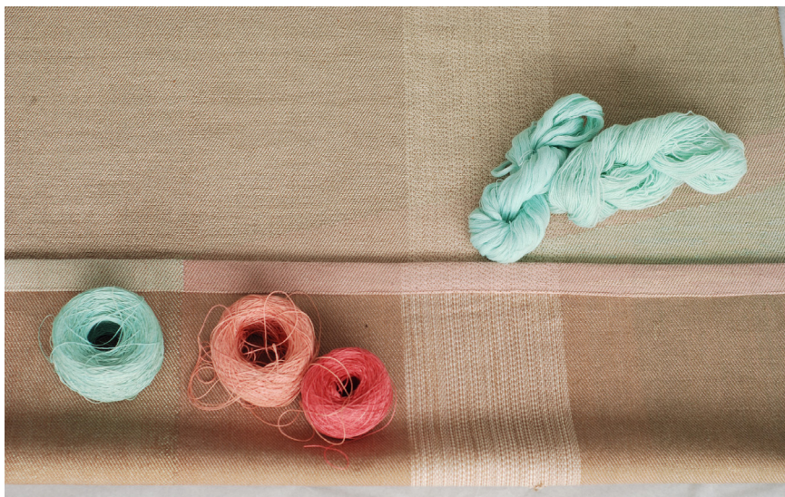
Gardiner skapade av konstnären Susanne Henriques för Domstolsverket i Jönköping har skadats av flamskyddsmedel. Tyget hade ursprungligen de klara pastellfärger som originalgarnet på bilden.

verkar för ett effektivt brandskydd. Partiell sprinkler är ett annat alternativ för att höja brandskyddsnivån. Ridåsprinkler bör installeras för scener över 120 m 2 (Boverkets byggregler, BFS 2011:6, BBR 18).