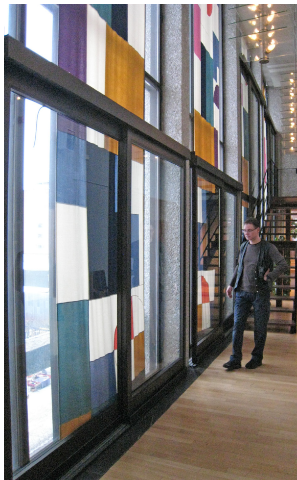
Alf Munthes gardin i Södertälje tingsrätt förstördes av flamskyddsbehandling. En nytillverkad kopia hänger där idag, ej flamskyddad. Efter ombyggnaden skyddas den av glas.