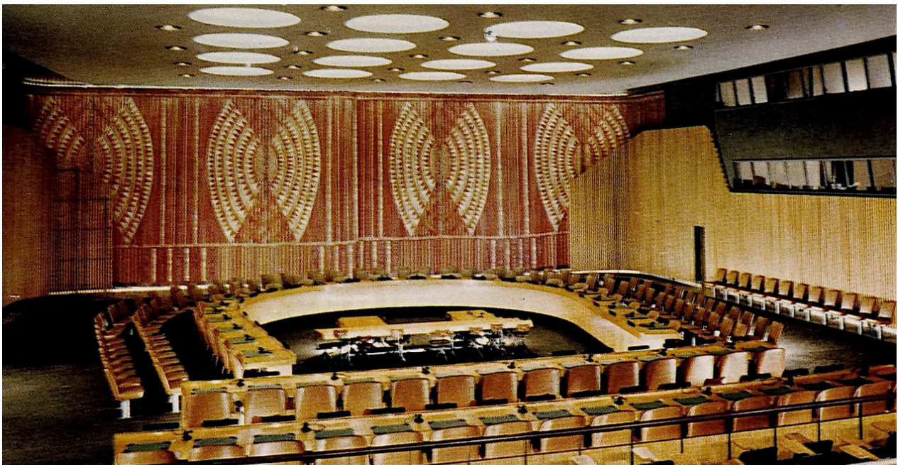
Ett av modernismens stora konstverk: ridån, skapad av Marianne Richter, till invigningen av FN-byggnaden i New York. Redan efter några år började ridån brytas ned. Idag återstår enbart fragment – några icke-flamskyddsbehandlade vävprover finns kvar. Foto: Vykort från 1950-talet.

Om det tekniska brandskyddet utformas utifrån en riskanalys, kan rökdetektorer placeras strategiskt invid textil konst. Planering av belysning och annan elektrisk apparatur, inredningens utformning samt lättillgängliga nödutgångar är andra faktorer som