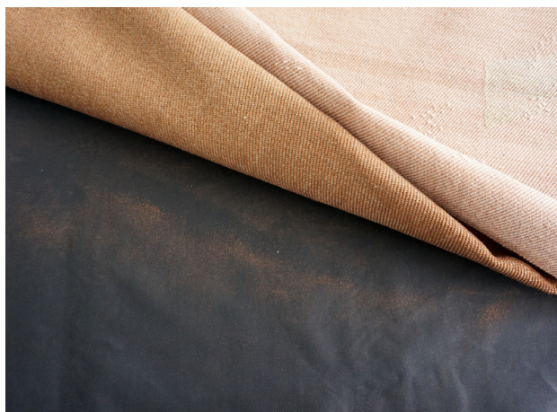
Tecken på nedbrytning av ett flamskyddsbehandlat konstverk kan vara att det dammar extra mycket och faller fibrer.