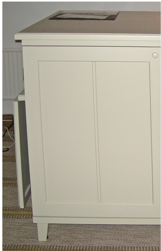
Skiva som kan fällas upp vid behov av arbetsyta.