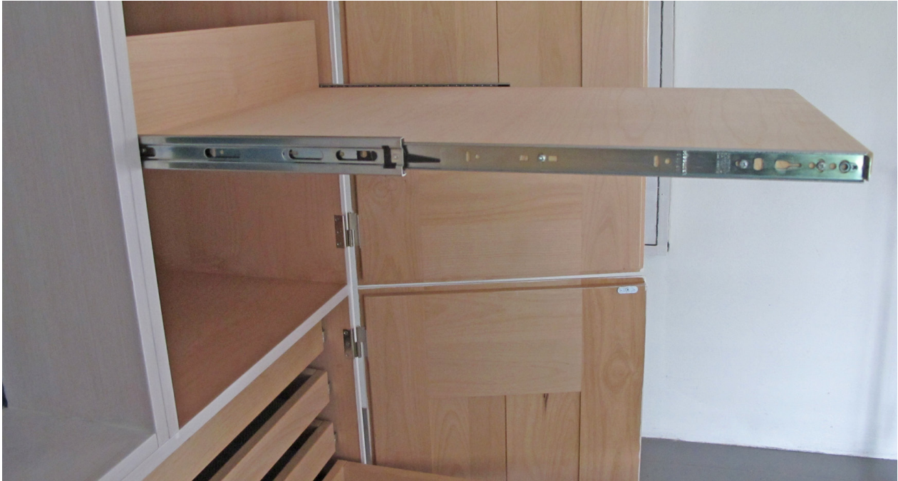
Utdragsskiva i textilförvaring.

En krok eller ställning för mässhaksgalgen är till bra hjälp utanför förvaringen. Där bör mässhakar, korkåpor, albor och röcklin hängas luftigt efter användning så att fukt vädras ut innan de hängs tillbaka i förvaringen.