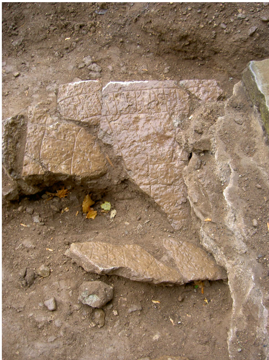
Bild 2. Den runristade gravhällen från Heda kyrka. Från söder.