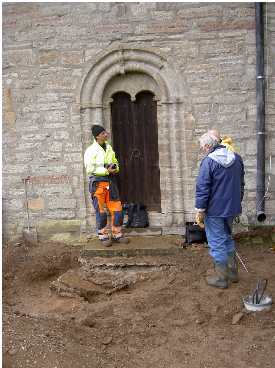
Bild 1. Gravhällen på fyndplatsen framför portalen till det norra sidoskeppet i Heda kyrka. Från väster.