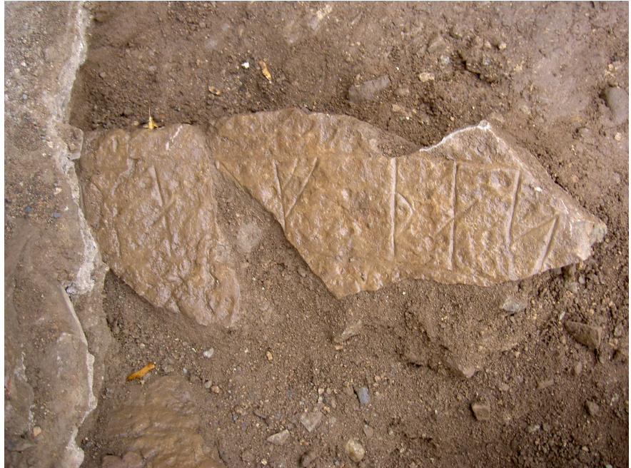
Bild 3. Detalj av fragmenten med runorna ...uulf : þas... (fragment 1–2 från vänster). Från norr.