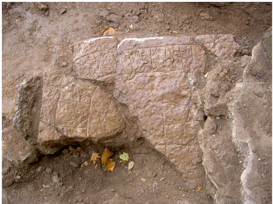
Bild 4. De övriga fyra fragmenten (fragment 3–6 räknade från vänster). Från söder.