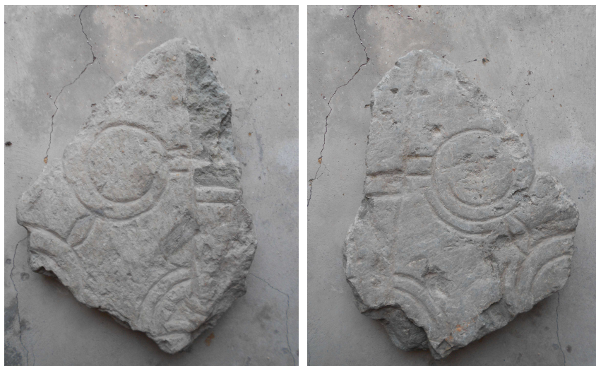
Fig. 1. Den ornerade gavelhällen från Fornåsa kyrka. Foto Magnus Källström 2012.

Det ornerade fragmentet är tidigast känt genom ett fotografi av O. Janse år 1900 (ATA), där det avbildas tillsammans med bl.a. ett gravhällsfragment med latinska bokstäver. Däremot verkar stenen inte ha undersökts av E. Brate.