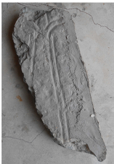
Fig. 3. Ornerad gavelhäll från Fornåsa kyrka. Foto Magnus Källström 2012.

Om fyndförhållandena verkar inget vara bekant. Den högra kanten av fragmentet är dock täckt av bruk och spår av bruk finns även på baksidan, vilket visar att den tidigare har varit inmurad någonstans. Ristningsytan verkar också vara överdragen med grå färg, vilket tyder på att den suttit utvändigt på kyrkan. Helt