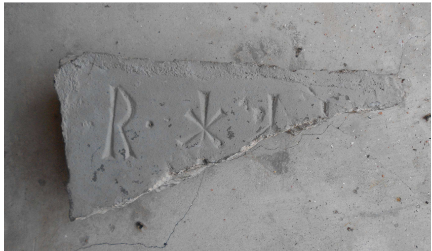
Fig. 2. Fragmentet av gravhällen Ög 35, som förvaras i Fornåsa kyrka.

Ristningsytan är överdragen med ett tjockt lager med grå färg. Baksidan av stenen är rå. Fastsittande bruk finns på den tillhuggna, ursprungliga kanten på fragmentet.