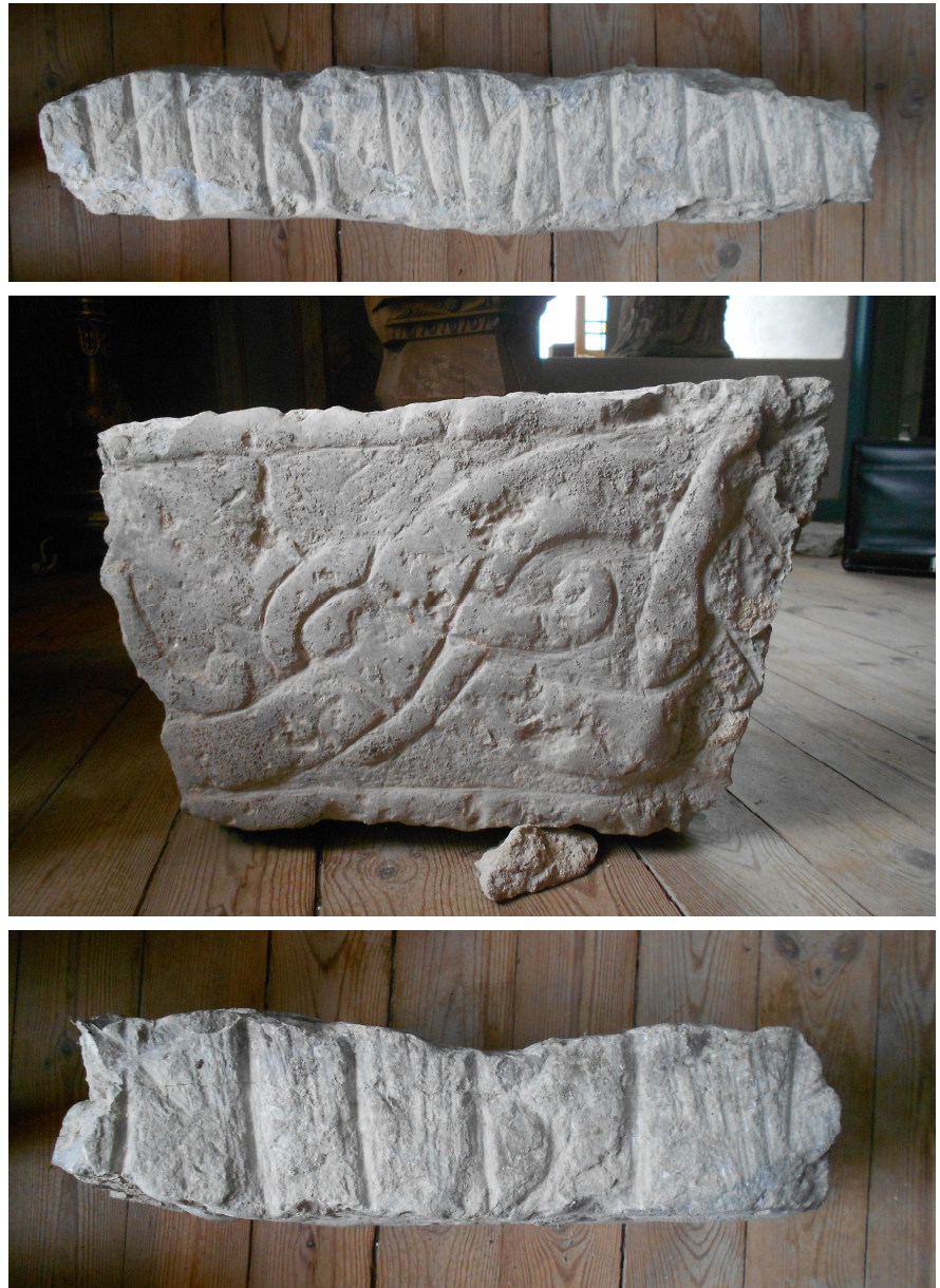
Fig. 4. Den på tre sidor ristade stenen Ög ATA4197/55 från Fornåsa kyrka. Foto Magnus Källström 2012.

Till läsningen: Av runa 1 återstår endast ett 5 cm långt mittparti av en huvudstav. Runan har inga bevarade bistavar, men kan ha haft sådana i toppen. På 2 a saknas förutom toppen även basen av huvudstaven. Runan har en dubbelsidig bistav som är förskjuten åt höger. Runa 3 har den på högra sidan den nedre delen av bågböjd bistav snett uppåt höger. Denna är högt ansatt, 7 cm ovanför basen,