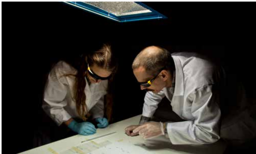
Test av limmers åldringsegenskaper med hjälp av solsimuleringslampa.

Läs mer om utrustning och kompetenser på