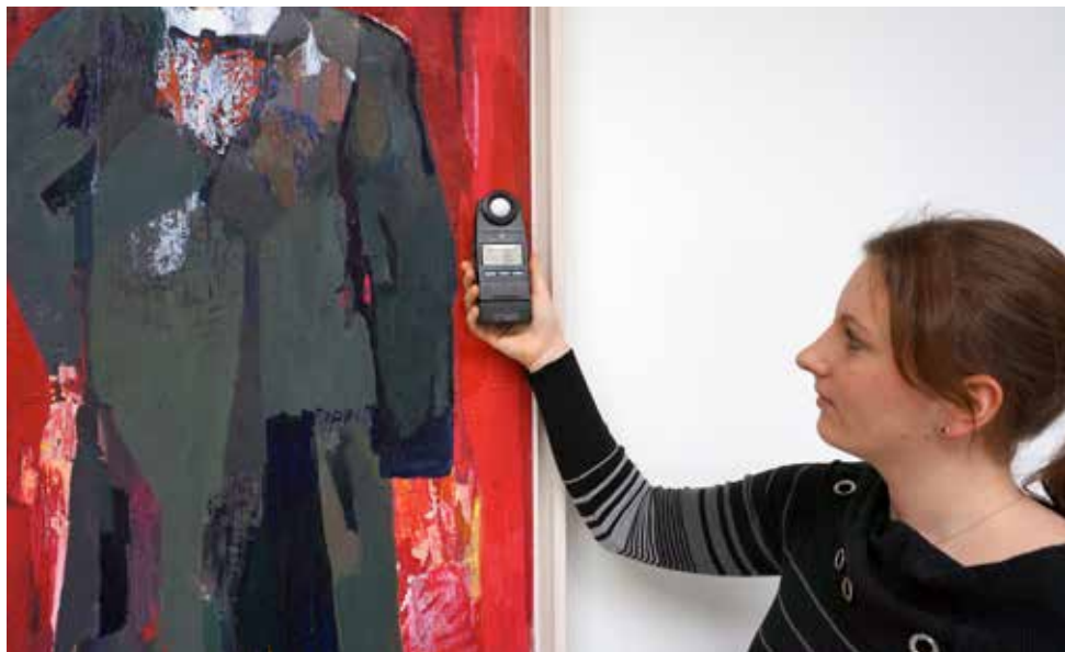
Mätning av ljus i utställningsmiljö. I bakgrunden syns del av konstverket "Tulla och Munch" av Cecilia Sikström.