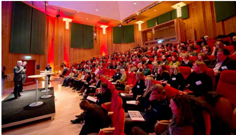
Samlingsforum i Karlstad 2013.

Riksantikvarieämbetet fångar upp behov, ser till att kunskap sprids och att det finns mötesplatser för utbyte av erfarenheter. Vi ger råd och stöd, driver och stöttar nätverk, anordnar seminarier och kurser samt bevakar omvärlden.