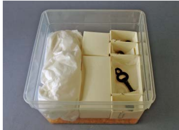
Fyll upp tomma utrymmen i förvaringslådan.