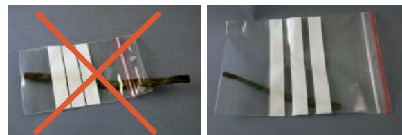
Inte så här.

Använd tillräckligt stora förvaringspåsar.