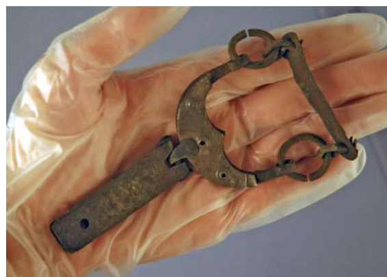
All hantering bör ske med handskar.