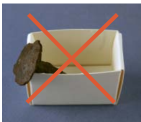
Inte så här.