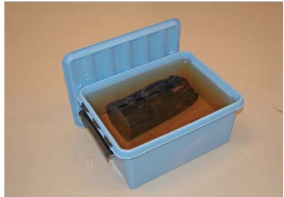
Träföremål nedsänkt i vatten.