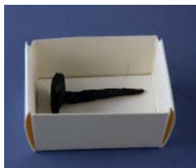
Utan så här.