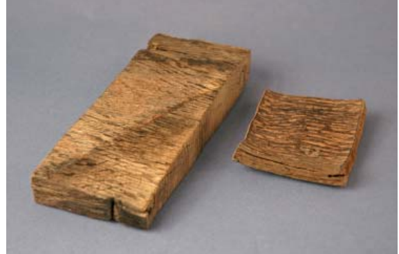
De två trästyckena var från början i samma storlek. Trästycket till vänster har konserverats. Trästycket till höger har fått torka okontrollerat utan någon konservering och har därmed deformerats och fullständigt förlorat sin ursprungliga form.