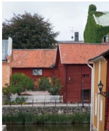
Kunskaper om tillämpningen av lagregler ökar möjligheterna att bevara, använda och utveckla kulturmiljöer i planeringen.

Riksantikvarieämbetet har i samarbete med Boverket utvecklat ett tema om kulturvärden i PBL-kunskapsbanken. Temat är en vägledning om hänsyn till kulturvärden i tillämpningen av plan- och bygglagen. Syftet är att stödja kommunerna genom att öka de kommunala planernas kunskaper om lagreglerna för att bevara, använda och utveckla kulturmiljöer. På sikt ska vägledningen bidra till att preciseringarna om kulturmiljö uppnås i målet om en god bebyggd miljö och i andra miljömål som påverkas av planeringen för markanvändning och bebyggelse.