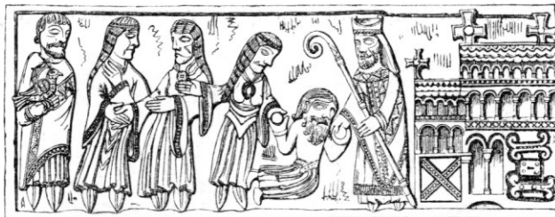
Fig. 2 a. Tredje sidan af Winchesterfunten.

biskop af Myra. De sex personerna å fig. 2 a synas häntyda på berättelsen om, huru den ädelmodige biskopen gaf skänker åt en utfattig och till förtviflan bragt ädling och såmedelst satte adelsmannen i stånd att gifva sina döttrar hemgift och skaffa dem män. Fadern ligger på knä för sin välgörare, som synes hafva gifvit honom tvenne guldmünt. 1 Just denna sistnämnda situation finnes framställd å funten från Od. Förklaringen till att man å Od-funten endast framställt ett moment i den sagda berättelsen synes mig hafva sin naturliga orsak däri, att funten i den lilla landskyrkan är mycket mindre än funten i den betydande Winchester katedralen. Att det motiv man då valt just blifvit det ifrågavarande synes mig också naturligt, enär detta motiv, äfven lösryckt ur sitt sammanhang, ju kunde lära menigheten ödmjukhet och vördnad inför den andliga myndigheten.