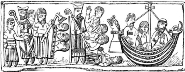
Fig. 2 b. Fjärde sidan af Winchesterfunten.

grym värdshusvärd. 1 4.) St. Nikolaus räddar trenne oskyldigt till döden dömda höfdingar samt ingriper, då de genom afundsmäns förtal för andra gången kastas i fängelse, ånyo till deras räddning genom att i sömnen uppenbara sig för kejsar Konstantin, deras herre. Bildframställningen å Winchester-funten slutar så med 5.) trenne män i en båt, erinrande om, huru Nikolaus räddade några sjöfarande från undergång. Å Od-funten saknas nu 2—4 under det att en 5.) liknande framställning finnes å densamma. Liksom valet af den först omtalade figurgruppen å Od-funten sannolikt ej skett på måfå, så har troligen den omständigheten att St. Nikolaus särskildt dyrkats såsom beskyddare af sjöfarande bidragit till valet af den sistnämnda bilden. 2 Till de nu framhållna likheterna i framställningen kan läggas en annan öfverensstämmelse de bägge dopfuntarna emellan, i det att liksom den engelska funten har två