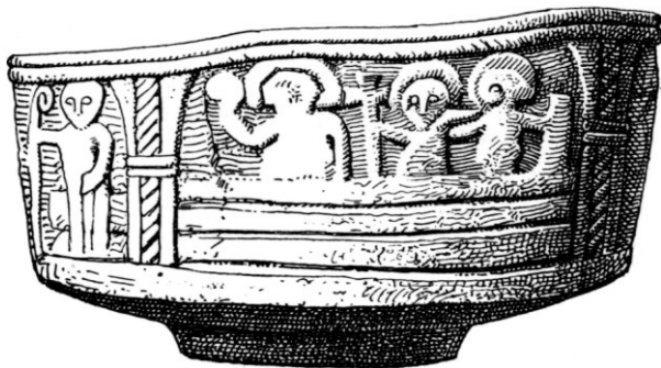
Fig. 1. Dopfunt från Ods kyrka Västergötland.

På grund af sitt material hafva de gamla dopfuntarna bättre än något annat inventarium i våra svenska kyrkor blifvit bevarade intill våra dagar. Då härtill kommer, att funtarna i de flesta fall äro ornerade, utgöra de ett viktigt material för studiet af kulturinflytelser under den katolska kyrkans första, mera ordnade skeden. 1