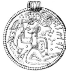
Fig. 9. Själland.

brakteaternas. De dubbla strecken öfver midjan, hvilka tyckas liksom klyfva mannen i två delar, men som tydligen skola föreställa ett bälte, ses äfven på brakteater. Å en dylik (fig. 8) synes en ridande mansfigur med bälte och tjocka vador. Med denna figur kan äfven jämföras ryttaren å Möjebrostenen (fig. 3), som också har det karakteristiska bältet, här dock med 3 tvärstreck, liksom