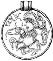
Fig. 6. Fyen(?).

De klufna fötterna äro likaledes synnerligen vanliga å brakteaterna.