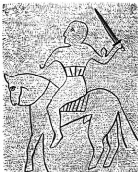
Fig. 3. Mjebrostenen. (Midtpartiet.)

ut som i Östergötland, Södermanland och Värmland, hvarför de ej torde ha varit obekanta för en uppländsk ristare.