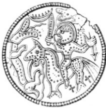
Fig. 8. Norge.

Äfven mansfigurerna å denna sten erbjuda vissa likheter med