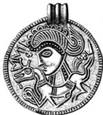
Fig. 4. Gotland.

Hvari bestå då likheterna mellan Häggebystenens djurfigurer och brakteaternas?