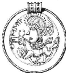
Fig. 5. Skåne(?).

Se vi till en början på hufvudet, så är dettas form nästan identiskt lika å stenen och å brakteaterna. Samma skarpt markerade mun med mer eller mindre öppna käftar och samma gränslinje mot halsen. Ur munnen på åtskilliga brakteatdjur hänger tungan långt ut liksom på dessa »hästar», fastän den ej är upprullad i spiral, hvartill ansatser likvisst ej saknas. Att beakta är framför allt »öronens» form. De bilda såväl på denna sten som å brakteaterna en sammanhängande halfmåne, här med utdragna spetsar, å brak-