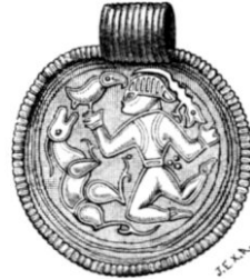
Fig. 7. Skåne.

Låren äro här tecknade på ett sätt, som ej är det vanliga å brakteaterna, men likväl förekommer.