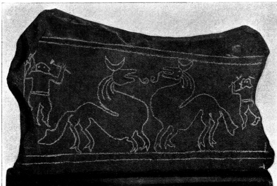
Fig. 1. Hägebysten.

Dybeck anser stenen vara samtidig med våra yngre runstenar. På tal om Hägebysten i folioupplagan af »Runa» 1865, sid. 57 säger han: »— — — — kan jag dock, ifråga om förevarande ristningars ålder icke neka mig att anmärka den ostridiga likheten i det ytterst ovanliga ristsättet, som förefinnes mellan desse och ristningen på en af Sigtunastenerna (Sveriges Runurkunder II, 189), en likhet, hvilken äfven tör kunna spåras å den thyvärr mycket förnötta Enhörnastenen, äfven en bildsten (Svenska Runurkunder I,