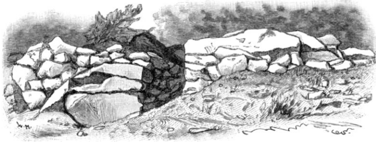
Fig. 3. Ingång genom öfre muren.

Murarnas läge samt i öfrigt förhållandena på platsen sätta det utom allt tvifvel, att, såsom ofvan blifvit antydt, dessa förskansningar varit afsedda att från innanför dem liggande, behärskande punkter försvaras med kastvapen, således ej i strid man mot man invid eller på murarna. Detta bestyrkes ytterligare af en rätt intressant omständighet. På flera ställen — vid E. på planen — träffar man nämligen hopförda förråd af kaststenar . Dessa äro liksom murens stenar skarpkantiga, men af mindre dimensioner än dessa: knappt hufvudstora och ännu mindre. De äro, därom kan intet