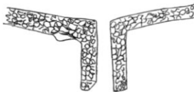
Fig. 4. Ingång till södra borgen.

Ehuru man på den nu beskrifna norra Tullinge-borgens förskansningar ej nedlagt arbete i någon ovanlig grad, torde dess försvarskraft genom bergets för ändamålet särdeles lyckliga skapnad kunna anses mycket betydande. Den var ett verkligt effektivt försvarsverk. Detta kan däremot ej sägas om den södra af de båda på gårdens egor belägna borgarna. Både genom konst och natur är den mindre befäst än den förra. Äfven detta borgberg ligger vid östra stranden af Tullinge-sjön, ungefär midt emot Hamra-Sjöstuga. Berget stiger temligen sakta från öster och bildar först vid vestra randen branta, stormfria väggar. Den konstgjorda förskansningen består af en enda betydande lång mur, som afskär den östra, sakta stigande sluttningen. Man har emellertid, förmodligen för att ej för mycket utsträcka förskansningslinien, ej begagnat sig