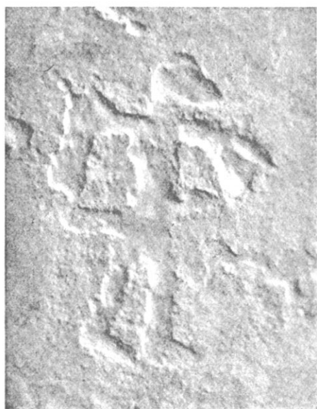
Fig. 9 - ( U_3 ).