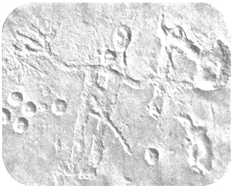
Fig. 10 - ( U_5 ).

FIG. 9, 10. HÄLLRISTNINGAR PÅ KINNEKULLE.