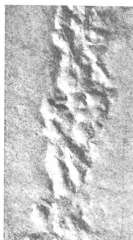
Fig. 11 - ( U_1 ).