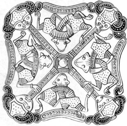
Fig. 7. Silfeerspänne. Skåne.

sent ursprung och vittnesgillheten är på grund deraf osäker. Jag vill förnämligast, under förutsättning att berättelsen förtjenar någon tillit, fästa uppmärksamhet dervid, att gudabilden var iklädd vanliga kläder, hvilket vittnar om en stor oförmåga i konstnärligt hänseende. De delar af guden, som ej voro klädda, måste hafva varit snidade, men voro de väl snidade? Jag kan ej tänka mig detta, då vi i våra jordfynd träffa framställningar af en valkyrja, som med dryckesbägaren helsar hjelten välkommen till Valhall, så beskaffade som fig. 9—11 visa. Det är icke konst, som uppenbarar sig i dessa gestalter, men väl ett försök att åstadkomma något i konstväg — ett försök, som ej var väl lyckadt.