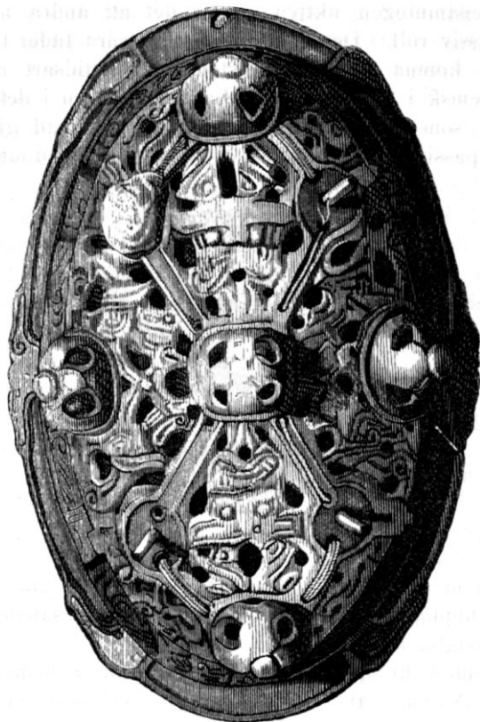
Fig. 3. Bronsspänne. Fastlandet.

det bibehöll sig ej synnerligen länge. I stället åstadkom man i gjutformen insänkta ornament, som å det gjutna föremålet voro upphöjda och der undergingo putsning, så att linierna blefvo skarpa. Detta förfaringssätt var vida beqvämare, men att inlåta sig derpå var att beträda ett sluttande plan: de på detta sätt åstadkomna