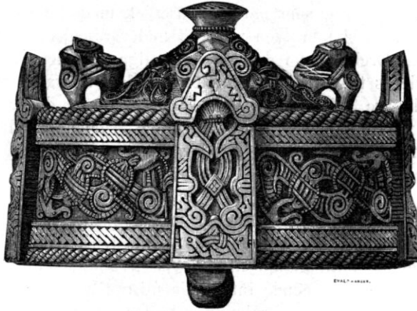
Fig. 4. Bronsspänne. Gotland.

mycket som återstår att förklara. Det en gång antagna animala motivet underkastades hvarjehanda förvandlingar. Ornamentsmotiv af detta senaste stadium förekomma t. ex. å det dosformiga spännet fig. 4, men spännen af denna grupp hafva, opraktiskt nog, en undersida, som var ornerad, ehuru ornamenten aldrig kunde synas, när spännet användes, med undersidan vänd mot klädningen eller kappan, och denna undersida visar ornament af en helt annan, mycket klarare typ (jfr fig. 5), samma typ, som vi återfinna på det svenska fastlandets, i synnerhet Upplands runstenar. Men den benlösa djurbild, som förekommer å dem, kan icke utan vidare betraktas som ett lån från figuren å det ifrågavarande gotländska spännets under-