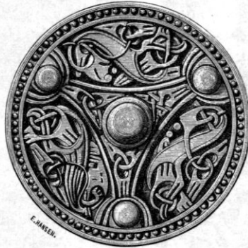
Fig. 2. Bronsspänne. Gotland.

Afvikelser i en sämre riktning äro undantag. Som regel kvarstår, att våra hedna fäder förstodo att väl skilja mellan aktiva och passiva delar å metallföremålen. Vi måste antaga att de besutto samma förmåga, när det gälde att behandla föremål af annan art, att således denna förmåga uppenbarade sig vid utförandet af den tidens byggnader af trä, i hvilka visserligen somliga delar göra skäl för benämningen aktiva, under det att andra aldrig spela mera än passiv roll. Denna förmåga kom våra fäder till nytta, då den utifrån komma byggnadskonsten i medeltidsart upptogs och gjordes inhemsk i Sverige. I de byggnader, som i detta afseende tjänstgjorde som förebilder, var visserligen skilnad gjord mellan aktiva och passiva delar; förmågan att göra skilnad mellan sådana