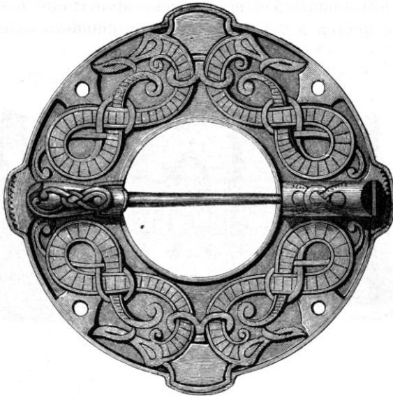
Fig. 5. Undersida af bronsspänne. Gotland.

tiden och å silfverföremålen från samma tid. Vi hafva här att göra med tvänne sidoordnade grupper, af hvilka hvardera i hufvudsak måste anses vara af inhemskt ursprung. Silfversmyckena, som förekomma samman med myntskatterna, visa en lineieornamentik, i filigran, som är fullständigt skild från hvad vi se å bronserna, det är här ibland fråga om band, oftare om linier i form af trådar (jfr fig. 6). Visserligen finnas silfversmycken försedda med en ornering i vanlig nordisk stil, t. ex. det i Skåne hittade spännet fig. 7.