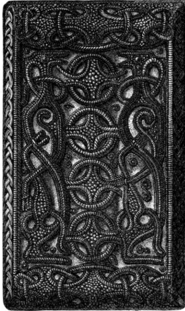
Fig. 8. Silverspännen. Östergötland.

Någon byggnadskonst fanns icke under den föregående tiden, som kan hafva utöfvat ett inflytande på den första kristna byggnadskonst, hvilken vi kunna inom eget land studera, nämligen byggnadskonsten i sten. Denna är af främmande ursprung.