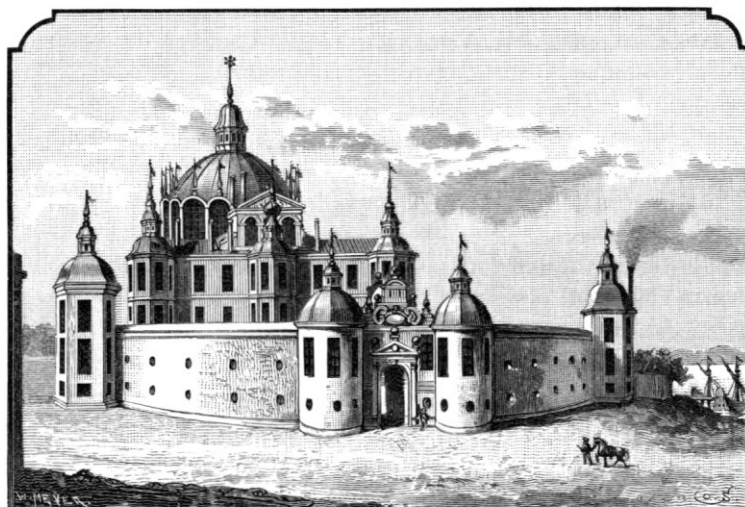
Fig. 1. Svartsjö gamla slott (efter Dahlbergs »Suecia«).