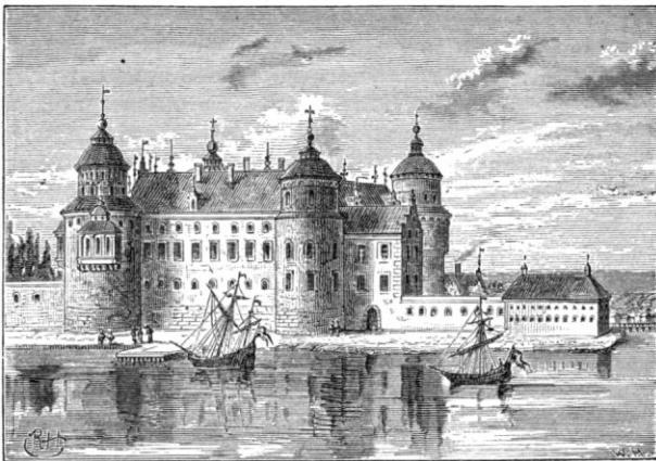
Fig. 1. Gripsholm, efter kopparsticket i Dalbergs Suecia.

i morgongåfva. Det var under det nu började skedet, som slottet fick sin slutliga gestaltning, sådan denna, med kanske några smärre afvikelser, framstår i Dahlbergs Suecia (fig. 1). Under sagda år voro ej mindre än 11 murmästare sysselsatta vid slottet; och till ett »proberehus», trossning, murning och gaflar åtgångo 258 läster 9 tunnor kalk, 47,100 tegel samt 11 tolfter bräder. År 1593 omtalas, att Eskil murmästare murade 50 famnar mur, och dessutom nämnas 6 andra murmästare. Särskildt bör märkas, att »thill Golfv vthi En ny Saall och till En M. N. H. Senge Kammar opå Slottet» åtgångo 5\frac{1}{2} tolft bottenbräder. Murningen kräfde, bland annat, 75,800 tegel. Huruvida en Jochin eller Jacob