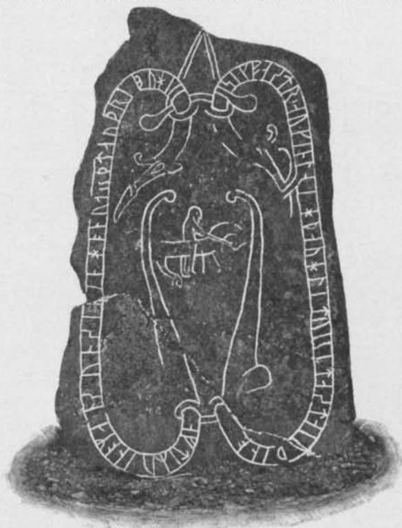
Fig. 1. Vidbostenen.

L. 605 bör sålunda sannolikt läsas: airikr + aukhakun +