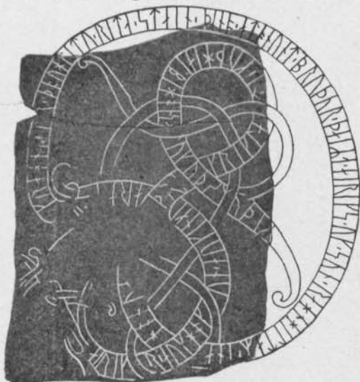
Fig. 2. Husby-Lyhundrastenen, kompletterad,